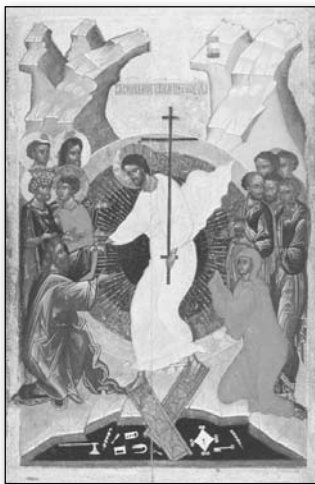
Coborârea la iad, icoană, sec. al XV-lea, Muzeul de Istorie și Arheologie, Novgorod.

ompoziția are la bază epistola Sfântului Apostol Petru ce ne amintește despre Mântuitorul care s-a dus și a propovăduit și duhurilor ce erau în temniță. 5 Hristos în smerenia Sa, asumându-și firea umană se pogorâre la iad, biruindu-l; eliberându-i pe protopărinții noștri, Adam și Eva împreună cu dreptii Vechiului Testament. Acest fapt constituie tema principală a sfintelor slujbe din Sâmbăta Mare și din praznicul Învierii, așa cum reiese din Irmosul canonului pascal- cântarea a 6-a: Pogorâtu-Te-ai în cele mai de jos ale pământului și ai sfărâmat încuietorile cele veșnice, care țineau pre cei legați, Hristoase; și a treia zi, precum Iona din chit, ai înviat din mormânt. 6