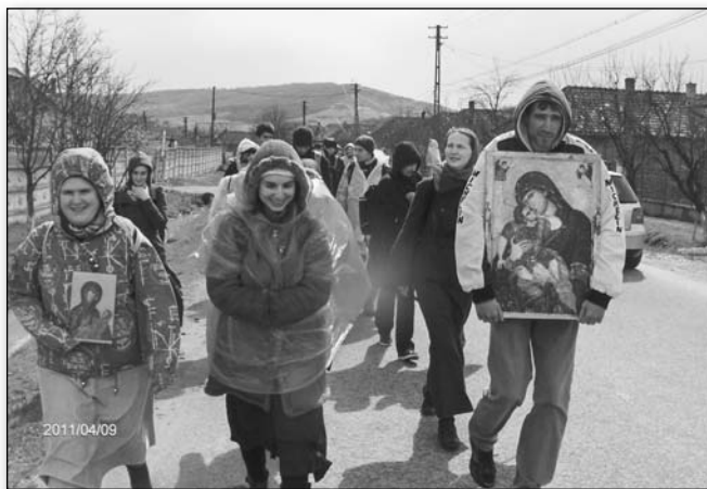
Cu dor de Maica Domnului, cu vrerea de a O cinsti, un grup de tineri clujeni au purces o distanță de 23 de kilometri pe jos, într-un pelerinaj de o zi din Iclod spre Mănăstirea Nicula

Localitatea Iclod a fost aleasă pentru că aici a fost paroh în vremurile de demult preotul Luca, care a pictat Icoana făcătoare de minuni a Maicii Domnului cu Pruncul de la