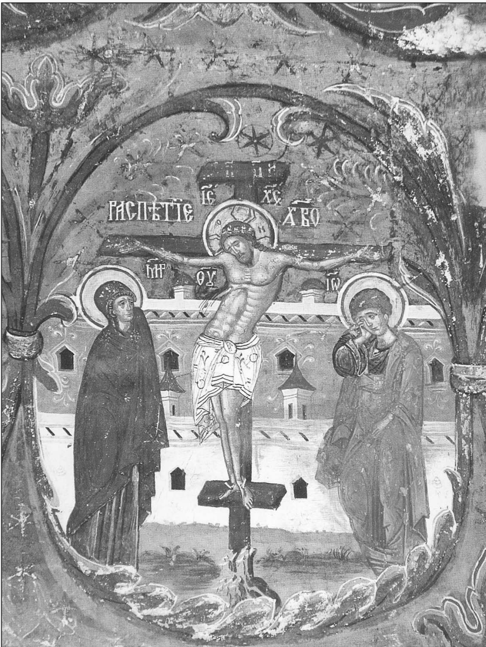
Răstignirea Domnului Iisus Hristos, detaliu din Arborele lui Iesei, Mănăstirea Sucevița

EDITURA ȘI REVISTA RENASȘTEREA UREAZĂ TUTUROR CITITORILOR ȘI COLABORATORILOR SĂRBĂTORI FERICITE!