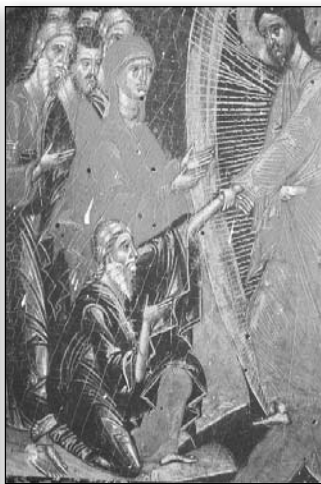
Coborârea la iad, icoană, detaliu, tempera pe lemn, sec. al XVI-lea, Muzeul Mănăstirii Bistrița.