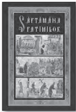
SĂPTĂMÎNA PATIMILOR, 122 pag., format 105x150 mm. Preț 4,5 LEI.