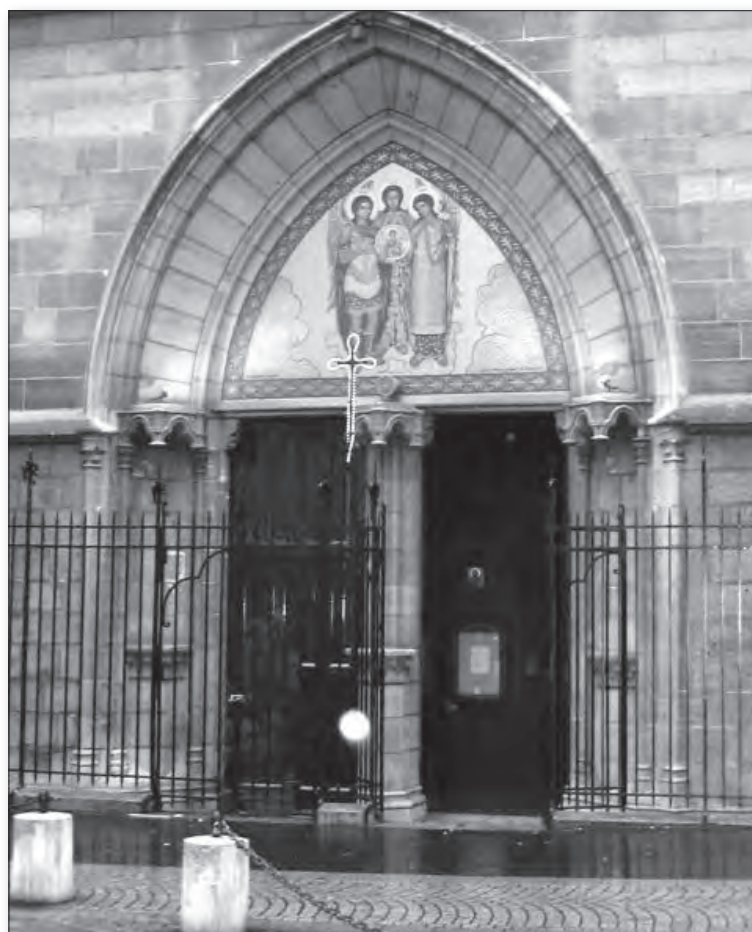
Intrarea în Biserica Ortodoxă Română de pe strada Jean Beauvais, Paris