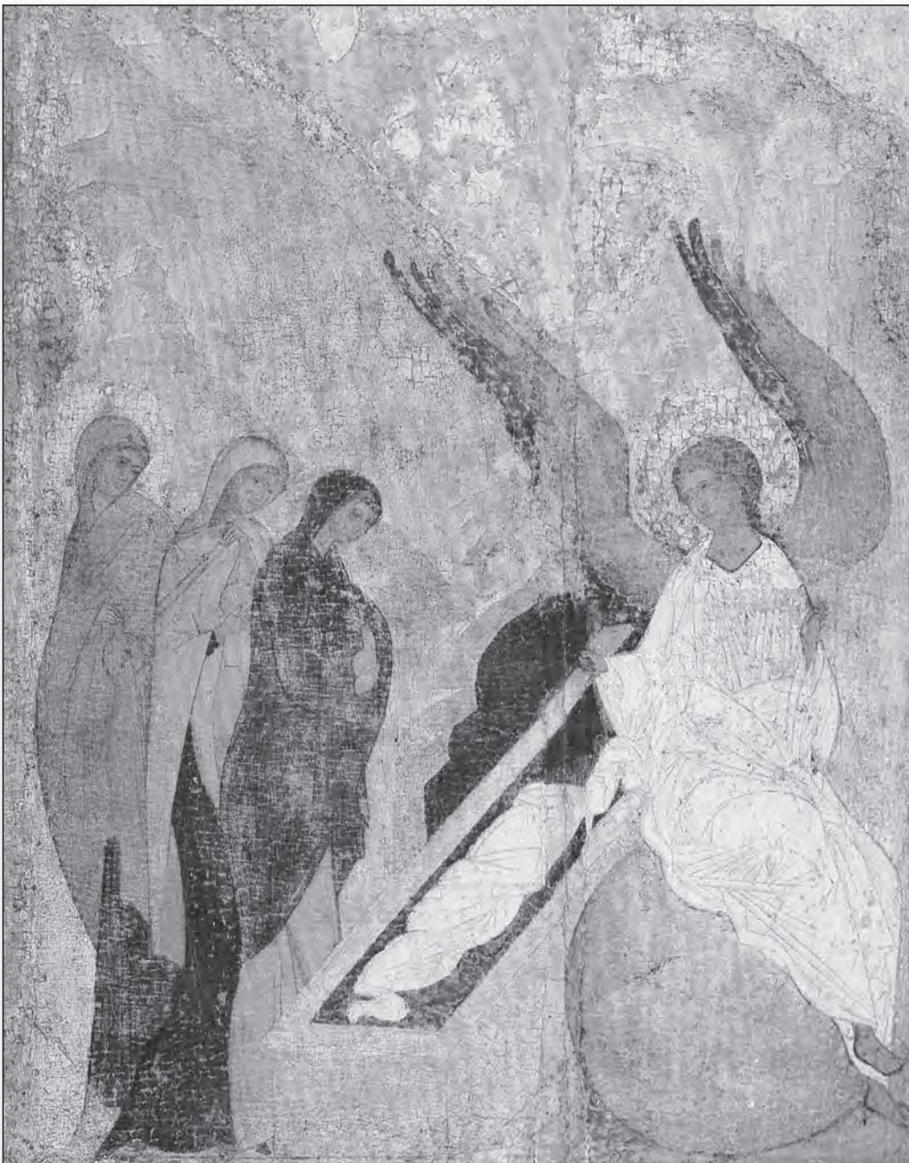
Mironosițele la Mormânt, Școala Rubliov, 1425-1427, Lavra Troița-Serghieva