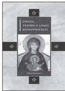
ICOANA, VEDERE A LUMII DUHOVNICEȘTI, A LUMII DUHOVNICEȘTI, 140 pag., format 135x200 mm, Preț 10 LEI.