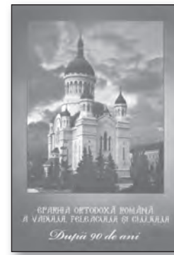
EPARHIA ORTODOXĂ ROMÂNĂ A VADULUI, FELEACULUI ȘI CLUJULUI, 239 pag., format 220x310 mm, Preț 95 LEI.