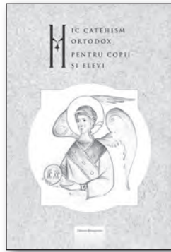
MIC CATEHISM ORTODOX PENTRU COPII ȘI ELEVI 66 pag., format 170x240 mm, Preț 9 LEI.