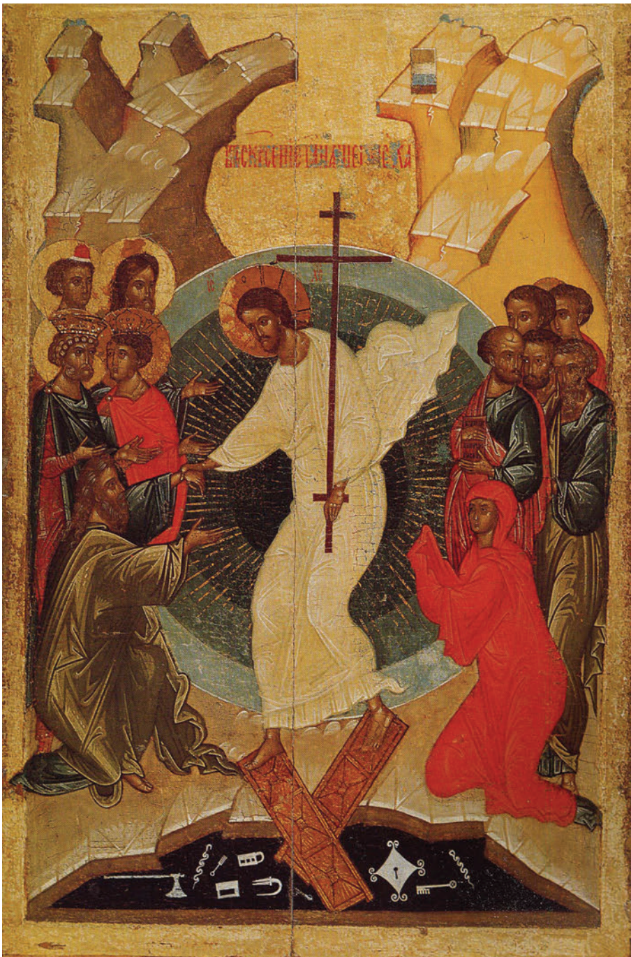
Pogorârea la iad, a doua jumătate a sec. XV, Novgorod, 89,5x59,5. Muzeul din Novgorod.