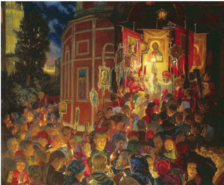
Paști. Tablou de Yuliya Kuzenkova, 2002.

Cea de-a zecea ediție a Congresului Național de Istorie a Presei, ale cărui lucrări se vor publica în curând și care a fost, pentru prima dată dedicat publicisticii religioase s-a constituit așadar, după cum am încercat să arătăm și, după cum am afirmat participanții la manifestare, într-un frumos eveniment de înaltă ținută academică, ce a reunit specialiști din toate marile centre din țară și străinătate și a creat cadrul unor discuții constructive, atât cu valențe evaluative, cât și cu scopul de a contribui la publicistica revuistică ulterioară din acest spațiu.