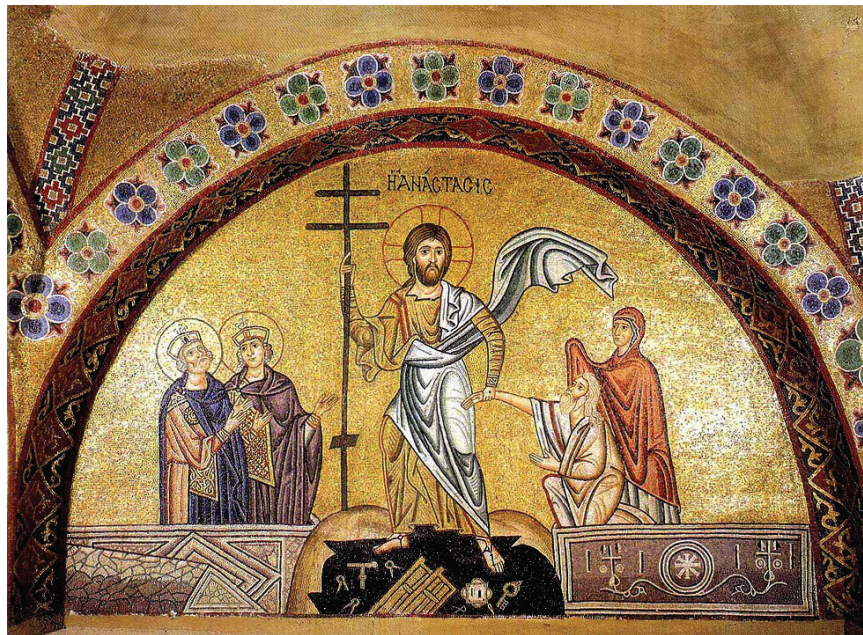
Învierea Domnului, mozaic, sec. al XI-lea, Mănăstirea Hosios Loukas

Privind aceste icoane ale Învierii, să ne raportăm la îndumnezeirea firii omenești și nădejdea de îndumnezeire și de înviere a propriului nostru ipostas, așa cum menționează în epistola sa Sfântul Apostol Pavel: pentru ca, precum Hristos a înviat din morți, prin slava Tatălui, așa să umblăm și noi întru înnoirea vieții (Romani 6, 4).