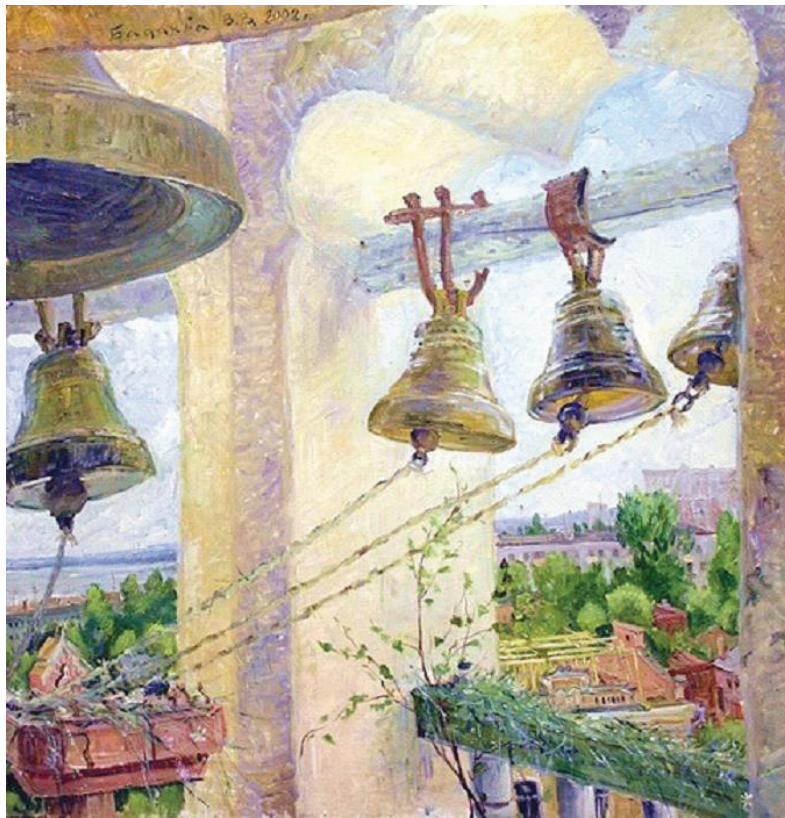
Trinity Sunday. Tablou pictat de Valery Badakva, 2002.