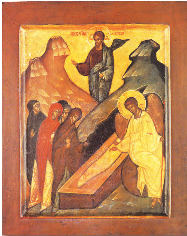
Învieria Domnului. Autor: Grigorie Krug.

Învieria lui Hristos, pe care o prăznuim cu atâtă solemnitate după mai multe zile de post, pocăință și rugăciune, este taina centrală a credinței și a vieții noastre în Hristos. Fără învierea lui Hristos, ne aflăm sub stăpânirea morții, a păcatului, și a diavolului, fără a exista vreun remediu pentru viața noastră. De aceea, Apostolul Pavel spune: „Iar dacă Hristos n-a înviat, zadarnică este credința voastră, sunteți încă în păcatele voastre” (1 Corinteni 15, 17). Prin Învierea Sa, Hristos ne-a dat harul pentru a învia sufletele noastre în viața aceasta, dar și trupurile noastre, la a doua Sa venire, așa cum mărturisim în simbolul de credință: „Aștept învierea morților, și viața veacului ce va să fie”.