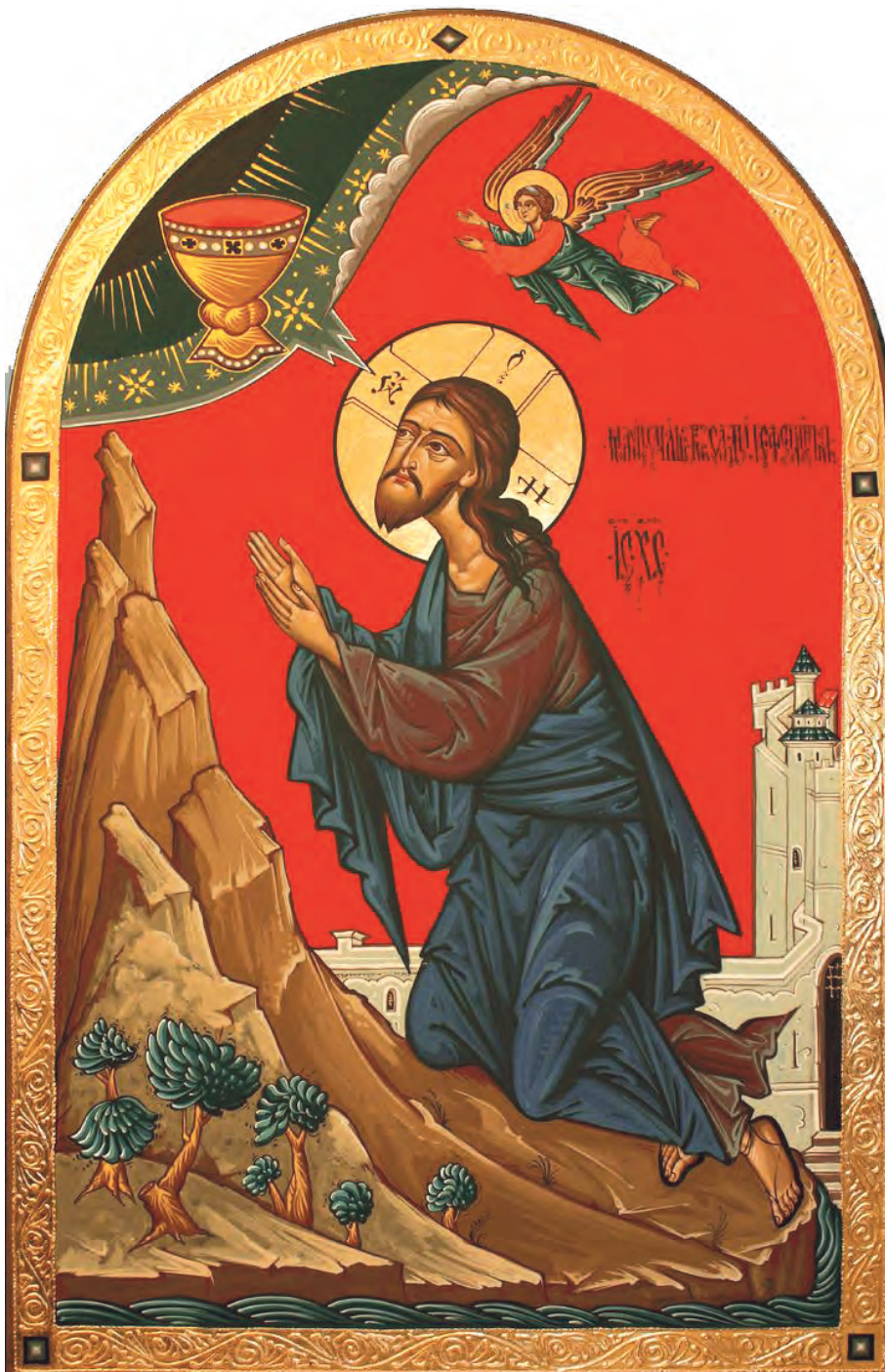
Rugăciunea lui Iisus în Grădina Ghețimani, Icoană rusească contemporană.

EDITATĂ DE ARHIEPISCOPIA ORTODOXĂ A VADULUI, FELEACULUI ȘI CLUJULUI