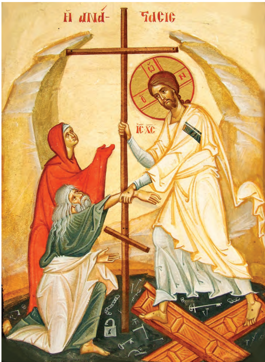
Învierea din morți, frescă pe lemn, autor: Ioan Popa, 30 / 20 cm, 2011.