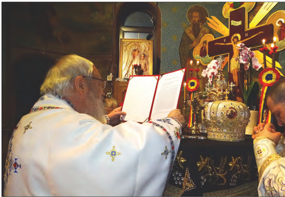
ÎPS Mitropolit Andrei, rostind Rugăciunea specială pentru încetarea epidemiei la finalul Sfintei Liturghii săvârșite la Mănăstirea Înălțarea Sfintei Cruci de la Cășiel, Protopopiatul Dej, 29 martie, 2020.

Pe scena din fața Catedralei Mitropolitane, slujește Vecernia, Paraclisul Maicii Domnului și rostește o cateheză. Hiroteseste întru duhovnic pe PC Pr. Olimpiu Ioan Vidican de la parohia Nimigea de Sus, protopopiatul Năsăud.