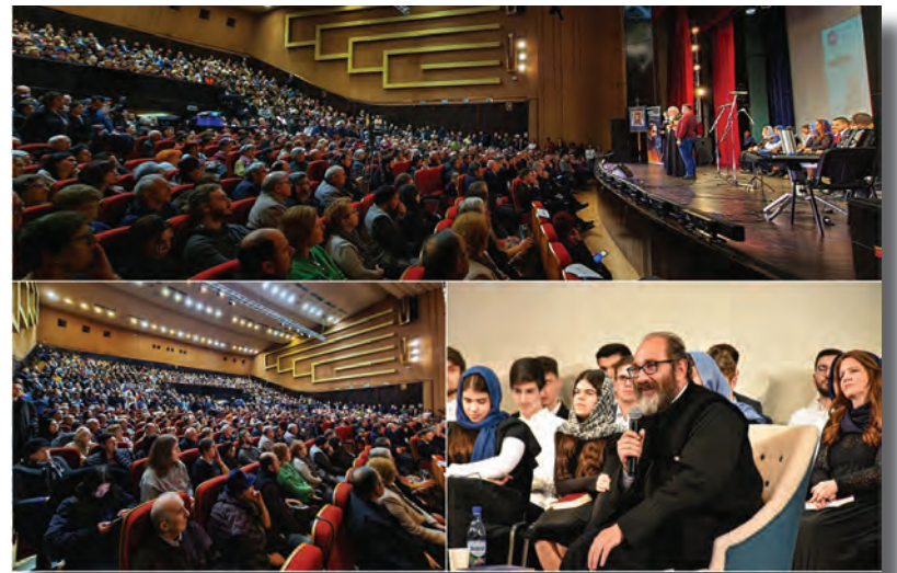
Conferința „Libertate și libertinaj”

Conferința a fost organizată de Asociația Creștină „Agape” și Asociația „Oastea Domnului” Cluj-Napoca, parteneri media fiind Trinitas TV și Radio Renașterea.