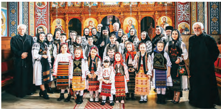
Preasfințitul Părinte Benedict Bistrițeanul, înconjurat de clerici și tineri în Biserica Sfântul Ioan Botezătorul din Parohia Poiana Ilvei, Protopopiatul Năsăud, 26 martie 2023.

17 martie: La reședința episcopală se întâlnește cu membrii grupului de lucru implicați în demararea construcției Centrului de îngrijiri paliative pediatrie Sfântul Hristofor .