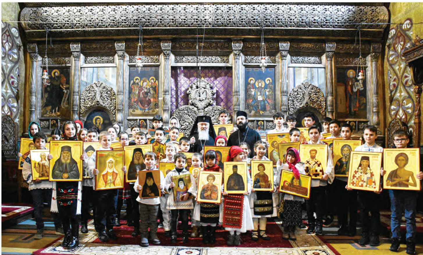
Înaltpreasfințitul Părinte Mitropolit Andrei, înconjurat de copii purtând icoane în Duminica Ortodoxiei, în Catedrala Mitropolitană din Cluj-Napoca, în seara zilei de 5 martie, 2023.

În sala mare a Casei de Cultură a Studenților din Cluj-