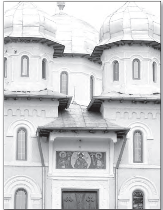
Biserica din Dervent

A ntre 10 și 20 iulie a.c., la Sfânta Mănăstire Dervent, s-a desfășurat cea de-a VII-a ediție a taberei internaționale de creație sub genericul „Dunărea și Dobrogea creștină”, tabără ce a reunit un grup semnificativ de artiști, 18 la număr. Dintre participanți s-au remarcat atât artiști de la noi din țară de la Dervent, Constanța, Cluj, Târgu-Jiu, Tulcea, cât și de la Korçë- Albania și Chișinău, Republica Moldova.