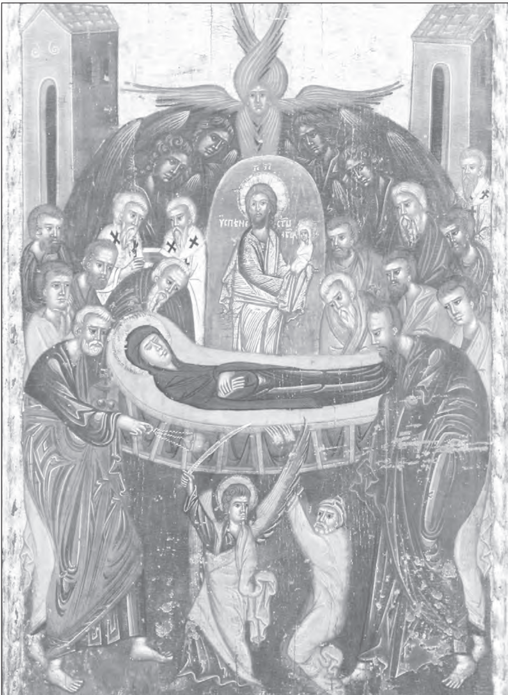
Adormirea Maicii Domnului, pictor moldovean, începutul secolului al XVI-lea, Nadăș, județul Cluj (icoană expusă în Muzeul Mitropoliei Clujului, Maramureșului și Sălajului)