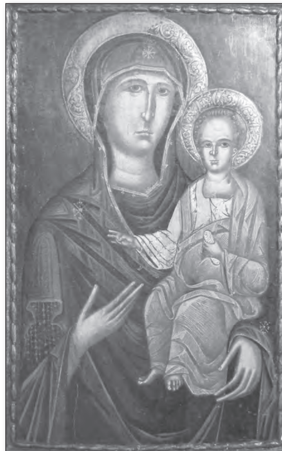
Hodighitria, pictor moldovean, sfârșitul secolului XV, începutul secolului XVI, Dezmir, județul Cluj (icoană expusă în Muzeul Mitropoliei Clujului, Maramureșului și Sălajului)

Am încercat să dovedesc că analogia nu-i cu puțință, atâta timp cât necredinciosul nu deține nicio experiență similară credinței și am ajuns acum să mă contrazic, vorbind despre posibilitatea analogiei divine. Aceasta fiindcă în locul argumentelor raționale ar trebui să-L lăsăm să lucreze pe Dumnezeu Însuși: argumentele