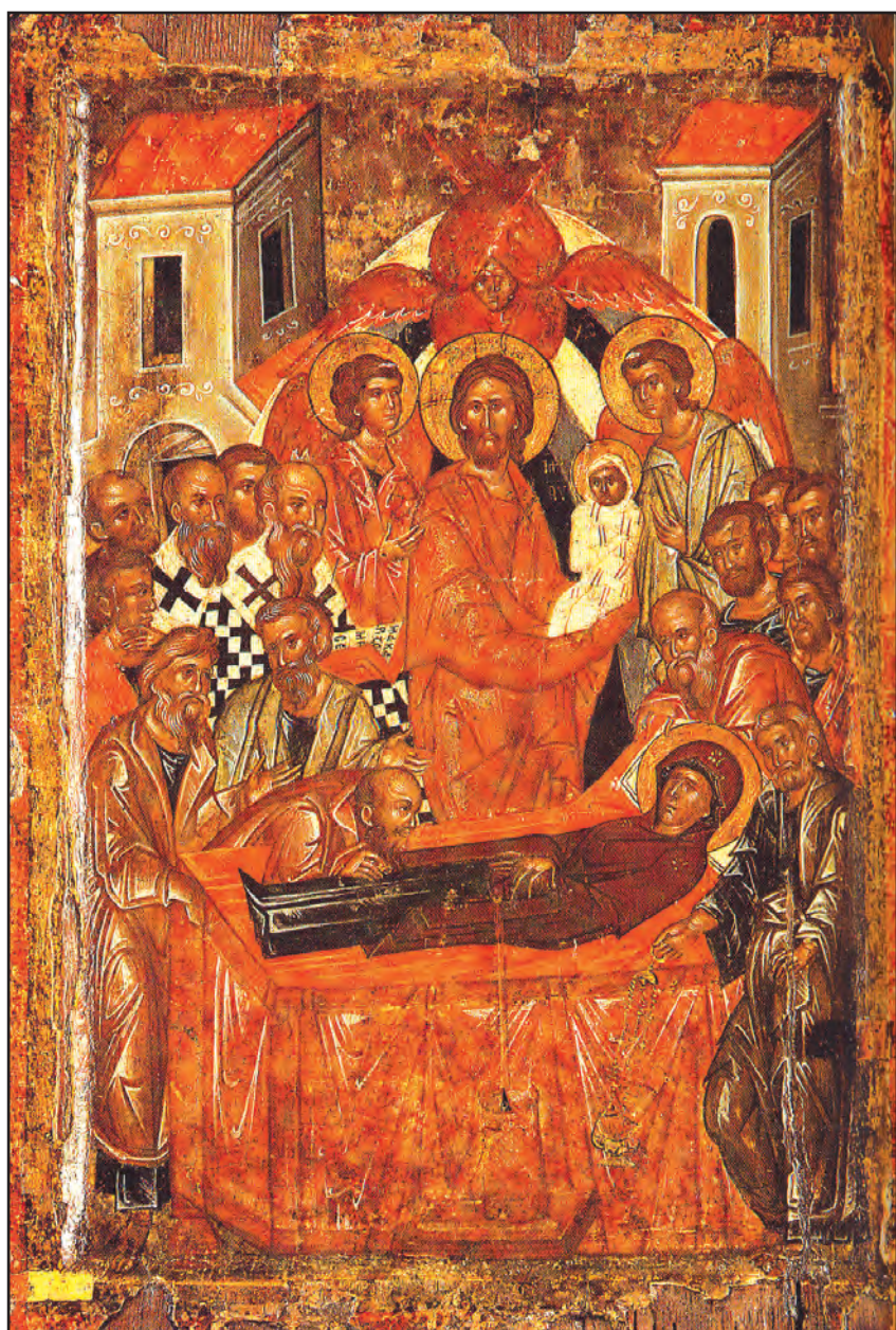
Adormirea Maicii Domnului, icoană portabilă, secolul XV, 39x27, Mănăstirea Toplou, Grecia.