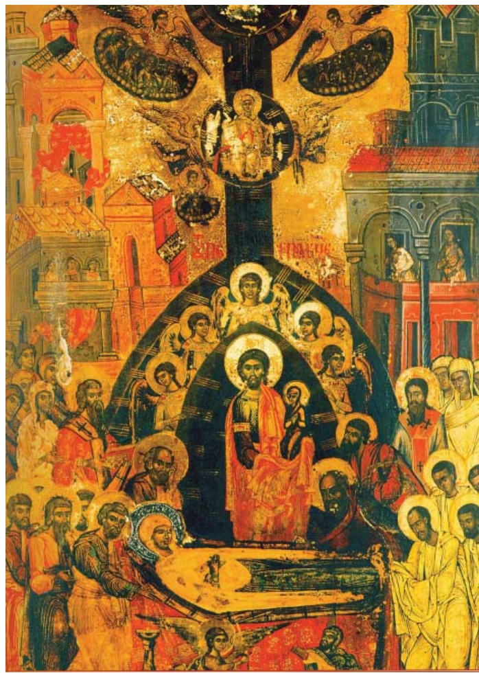
Adormirea Maicii Domnului, icoană pictată în secolul XVII de către Sfântul Cuvios Pafnutie - Pârnu (Mutu), Mănăstirea Sinaia, Prahova.

Atât ca structură liturgică, cât și ca tematică a imnografiei, praznicul de pe 15 august ne apare ca o celebrare pascală tainică. Biserica prăznuiește mai înainte de sfârșitul veacurilor taina gustării din primele roade eshatologice: „La viața cea pururea veșnică și mai bună, moartea ta a fost trecere (paști n. n.), Curată; din cea vremelnică, la cea dumnezeiască cu adevărat și netrecătoare, mutându-te”, cântăm în Canonul Praznicului (cântarea a IV-a). Iar Troparul face următoarele afirmații: „Întru naștere fecioria ai păzit, întru adormire lumea nu ai părăsit, de Dumnezeu Născătoare; mutat-te-ai la viață, fiind Maica Vieții și cu rugăciunile tale izbăvești din moarte sufletele noastre”. Înțelegem, așadar, că Fecioara Maria este pentru noi model și anticipare a destinului nostru de viață și slavă eshatologică. Biserica ne învață la praznicul Adormirii ei să prețuim și să cultivăm viața. Praznicul Adormirii Maicii Domnului e sărbătoarea speranței împlinirii noastre de aici și din eternitate al cărui model este și rămâne pururea, Maica Domnului.