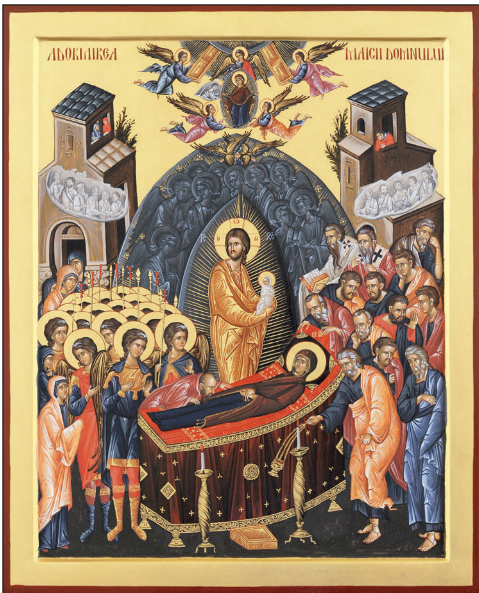
Adormirea Maicii Domnului, icoană portabilă contemporană. Autor: Călin Vădan