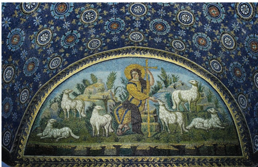
Păstorul cel Bun, mozaic din mausoleumul Galla Placidia, Ravenna, Italia. sec. V d.H.

În simbolismul sacramental ioaneic, „Pășunea” de care vorbește Mântuitorul Hristos nu este alta decât hrana spre viață veșnică, adică Sfânta Euharistie, în care creștinul găsește sensul deplin al vieții lui. Texte vechitamentare, având ca subiect poporul ales, așezat de Dumnezeu în Țara Făgăduinței, în care a aflat bunăstarea deplină, ca dar al lui Dumnezeu, au prevestit abundența de har și binecuvântare cerească din era mesianică viitoare. Iată câteva dintre aceste texte cu caracter profetic-simbolic pentru