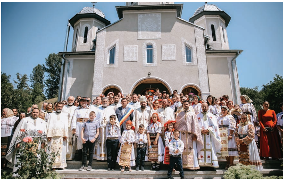
Preafințitul Părinte Benedict Bistrițeanu, înconjurat de participanți la Sfânta Liturghie săvârșită în Parohia Hălmășău, Protopopiatul Beclean, 23 iulie 2022.

14 iulie: Slujește Sfânta Liturghie la paraclisul episcopal cu hramul Sfinții Benedict de Nursia și Isaac de Ninive.