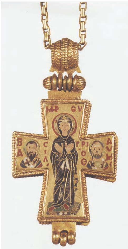
Cruce-relicvar cu Maica Domnului având de-a dreapta ei pe Sfântul Vasile cel Mare, iar în stânga pe Sfântul Grigorie Taumaturgul; sec. X-XI, aur emailat, proveniență: Constantinopol. British Museum, Londra

unui aisberg, care se vede puțin și mai mult rămâne ascuns, iar frumusețea ei vine tocmai din acest echilibru de părți inegale, reflectând cele ale Împărăției față în față cu cele ale lumii. De aici și primul indiciu în calea vieții spirituale - taina se lucrează și se trăiește înăuntru și bucuria se dobândește și se păstrează numai în această paradigmă. Despre Maica Domnului, Evanghelistul Luca afirmă în două rânduri: „Maria păstra toate aceste cuvinte, punându-le în inima sa” (Luca 2, 19, 51), argumentând viețuirea sa tainică, isihastă, ascunsă de ochii lumii, descrisă în termenii excelenței, în culorile smereniei, a delicateții și a discreției cu privire la lucrarea lui Dumnezeu cu ea. Maica Domnului Îl apropie pe Domnul de noi, ni-L arată vorbind în mijlocul nostru și cu noi, Îl descoperă ca unul din neamul nostru, lucru radical nou, total surprinzător și cu efecte definitive. Accentul pe care îl pune Sfântul Isaac se referă, mai ales, la posibilitatea de a-L vedea față către față, și acest lucru fără a ne înspăimânta pe modelul Vechiului Legământ - „Nu poate vedea omul fața Mea și să trăiască” (Ieșire 33, 20), indicând scopul și ținta omului pe pământ - vederea lui Dumnezeu. Această „noutate” arată o schimbare și o diferență desăvârșită dintre cele vechi și cele noi, dintre cele dinainte și cele de acum, prin acel „alt chip”, așa cum apare la părintele filocalic.