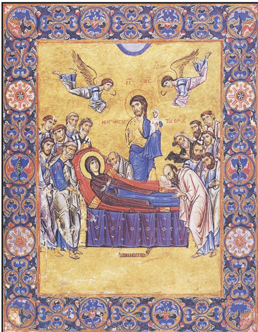
Adormirea Maicii Domnului. Miniatură dintr-un lectionar al Marii Lavre, fol. 134, Sfântul Munte Athos.