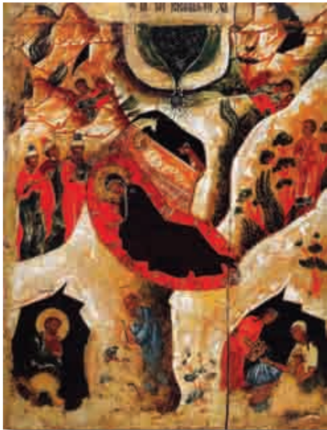
Nașterea Domnului, icoană rusească de la sfârșitul secolului XVII, Muzeul de Artă Figurativă din Arhanghelsk, Rusia.

Îl vom avea mereu în memorie cu participările sale la Sfântul Sinod și-i vom duce lipsa. Dumnezeu să-l odihnească!