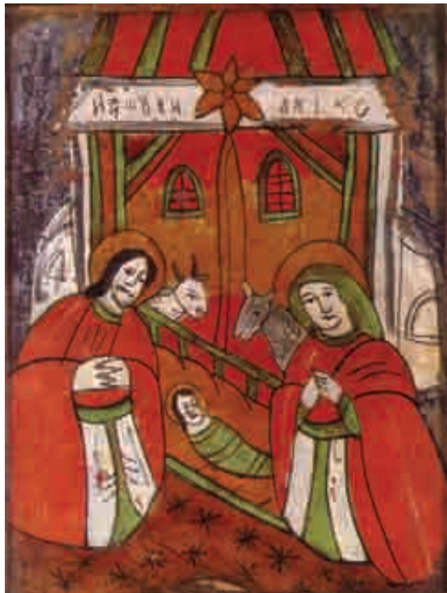
Nașterea Domnului, sec. al XVIII-lea, Școala de la Nicula.

cazul icoanelor pe lemn sau a frescelor, tema iconografică a Nașterii Domnului cuprinde până la cinci scene adiacente (închinarea magilor, îngerii vestitori, păstorii și Dreptul Iosif, spălarea Pruncului Iisus și ieslea cu Maica Domnului împreună cu Iisus), în pictura pe sticlă, meșterii anonimi au găsit de cuviință să reducă complexitatea scenei la ceea ce consti-