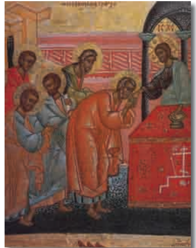
Împărtășirea Apostolilor, icoană pe uși împărătești, sfârșitul sec. XVI, Școala din Stroganov, 89x111,3 Muzeul de Istorie și Artă din Solvycegodsk, Rusia.

Pentru Sfântul Ioan de Kronstadt, Sfânta Liturghie era „cerul pe pământ”, căci „în timpul Liturghiei, cerul și pământul se fac una” (cf. Liturghia – Cerul pe pământ ). Pentru aceasta preotul trebuie să o slujească cu toată curățenia sufletească și trupească, nepătămire, dragoste, pace, evlavie și frică. Liturghia nu este numai o rememorare a iconomiei dumnezeiești, ci are un caracter comunitar și pascal prin care se zidește Biserica - Trupul lui Hristos, având o importanță deosebită implicarea poporului și de aceea ar fi „mai folositor pentru mintea și inima creștinului ca el să cunoască întreg cuprinsul Liturghiei” ( ibidem ). „Liturghia este pentru credincioși o pavăză și o ripostă în fața necontenitei dezamăgiri care domnește în lume” ( ibidem ). De aceea, Sfântul Ioan îndemna la o cât mai curată și deasă împărtășanie. Zilnic împărtășea între 300-500 de credincioși iar în Postul Mare până la câteva mii pe zi. Fiindcă nu mai făcea față cu spovedirea unui număr atât de mare de oameni, a primit din partea Sfântului Sinod îngăduința de a practica Spovedania publică.