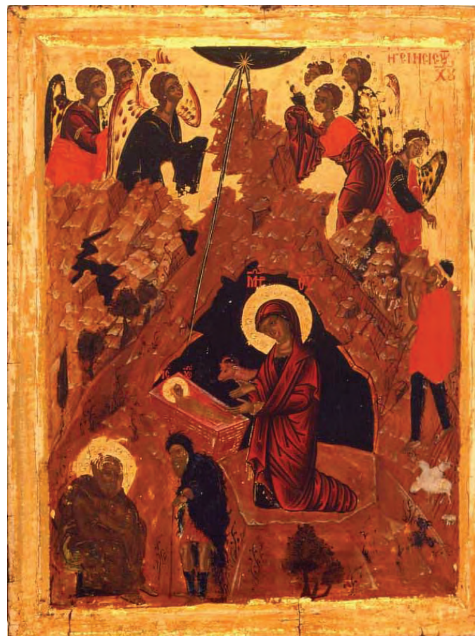
Nașterea Domnului, sec. XVIII, Mănăstirea Sfântul Pavel din Sfântul Munte Athos.

Încheiem, lansând din nou, alături de imnograf, invitația să ne continuăm călătoria duhovnicească și în aceste ultime zile de pregătire pentru Crăciun: „Cel ce locuiește întru lumina cea neapropiată și împreună ține toate pentru milostivirea cea negrăită, din Fecioară Se naște și cu scutece Se înfășă ca un Prunc în peșteră și în ieslea dobitoacelor Se culcă; să ne grăbim a veni în Betleem la închinarea Lui împreună cu magii, aducându-i roade de fapte cuvivoase, ca niște daruri” (24 XII).