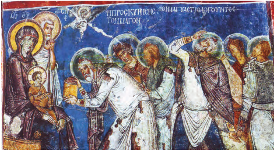
Închinarea Magilor, frescă, sec. al XII-lea, Capadocia

Tema este pictată, cu prioritate în Biserica Ortodoxă în registrul