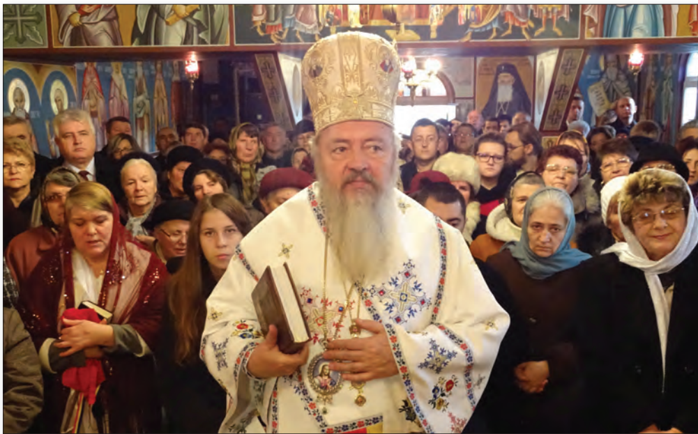
IPS Mitropolitul Andrei slujind Sfânta Liturghie în Biserica din localitatea Cornești, Protopopiatul Turda, 22 noiembrie 2015.

În biserica Mănăstirii Nicula, săvârșește slujba de înmormântare pentru adormitul întru Domnul, Iosif Berindeiu. Rostește un