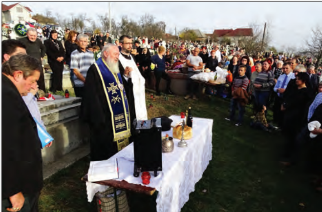
IPS Mitropolit Andrei oficiind Parastasul de obște în cimitirul din satul natal, Oarța de Sus, județul Maramureș, 3 noiembrie, 2018.

Primește la Reședința Mitropolitană din Cluj-Napoca pe PS Părinte Veniamin, Episcopul Basarabiei de Sud.