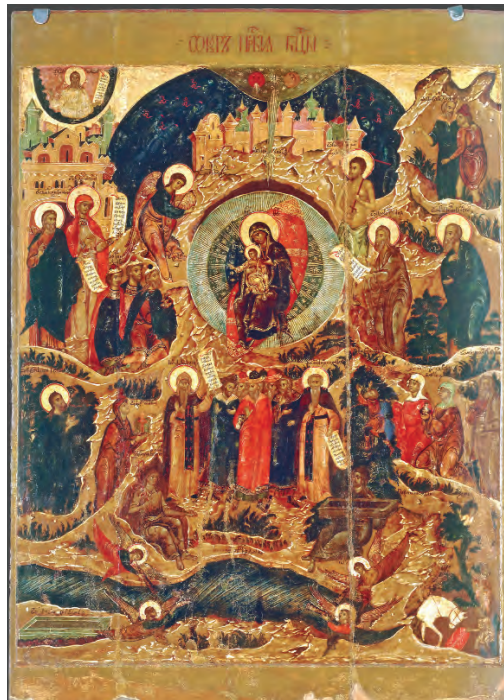
Soborul Maicii Domnului, icoană rusească în tempera pe lemn, sec. al XVII-lea.