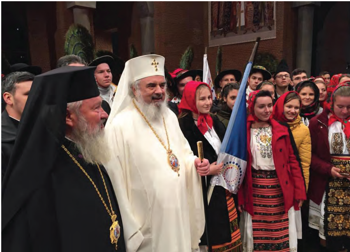
Preafericitul Părinte Patriarh Daniel și Înaltpreasfințitul Părinte Andrei, Mitropolitul Clujului, Maramureșului și Sălajului, alături de tineri prezenți la sfințirea Altarului Catedralei Mântuirii Neamului la București, 25 noiembrie, 2018.

25 Noiembrie: În sobor de arhieriei, sub protia Patriarhului Ecumenic, Bartolomeu și a Patriarhului României, Daniel, participă la slujba de sfințire a Altarului Catedralei Mântuirii Neamului. Slujește la Sfânta Liturghie săvârșită cu acest istoric prilej.