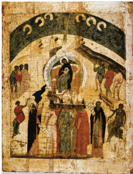
Soborul Maicii Domnului, icoană rusească în tempera pe lemn, sec. al XV-lea.