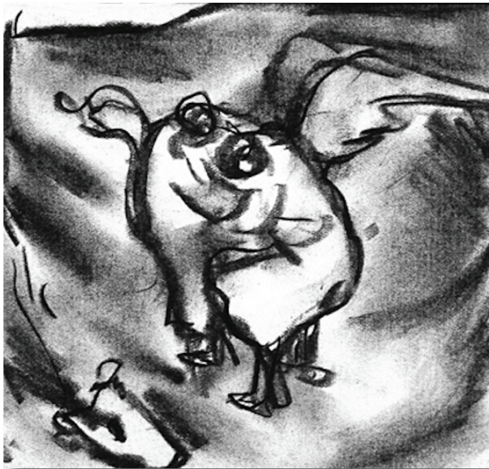
Lupta lui Iacov cu ingerul. Corneliu Baba, desen cu cărbune, 1976.

exprimă această radicală diferență între înainte și după – Iacov devine Israel, pentru că a îndrăznit să se lupte cu Dumnezeu și cu oamenii și a ieșit biruitor (32, 29). I (ni) se schimbă numele și deodată viața, de pe urma întâlnirii „față către față” cu Dumnezeu (32, 30-31). „Și-a câștigat” binecuvântarea lui Dumnezeu, însă nu fără durere și efecte în timp, care să-i amintească de fragilitatea și vulnerabilitatea umană și să-i indice calea încrederii mai mult în Dumnezeu și mai puțin în propriile puteri. Lupta nu poate fi egală, deși Dumnezeu se lasă provocat de om. Dumnezeu îl cunoaște pe om și îi pune nume, însă omul nu poate să-l cunoască pe cel al lui Dumnezeu, pentru că „e minunat”, mai presus de ceea ce el poate să primească, să audă și să cunoască. Însă, ca o mângâiere, ca o amintire, ca un semn al prezenței, locul