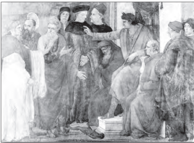
Simon Magul în dispută cu Petru și Pavel în fața împăratului Nero. Frescă de Filippo Lippi (1457-1504) în basilica Santa Maria del Carmine, Florența.

La finele lui 2011, drept reacție la scandaluri mondene cu urmări penale, luminile reflectoarelor au fost direcționate asupra unui fenomen greu de încadrat pentru majoritatea comentatorilor faptului social. Pentru câteva zile, ecranul mediatic a fost ocupat de figurile pitorești ale unor vrăjitoare în război cu gramatica limbii române, dar în armonie cu forțele misterioase ale universului. Inclusiv presa internațională s-a grăbit să relateze, mai mult sau mai puțin exact, despre „vânătoarea de vrăjitoare” declanșată în România. Pentru a căta oară, am reușit să surprindem, să ne consternăm contemporanii. Ca și cum cazul Tanacu nu ar fi fost suficient, iată că avem și această istorie bizară, vandabilă la o adică, legată de vrăjitorie. Undeva, la capătul estic al Europei, acolo unde se termină civilizația, se descoperă ochilor uimiți ai omului postmodern o lume mustind de magie, de duhuri și poțiuni. Dacă universul lui Harry Potter poate fi retrăit în parcuri tematice de distracții, iată că vrăjile pot fi experimentate „pe bune” într-o țară care, era să uit, l-a dat și pe legendarul Dracula. Una peste alta, ca prin vrajă, câștigul brand -ului