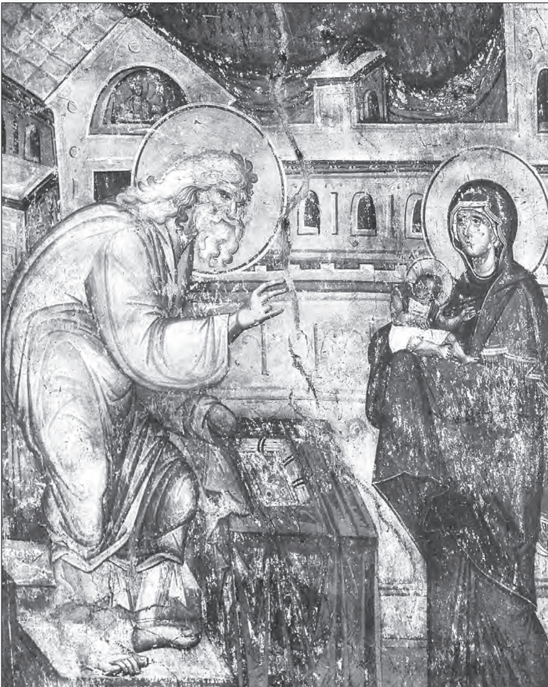
Întâmpinarea Domnului, Manuel Panselinos, Protaton, Athos, ~1300