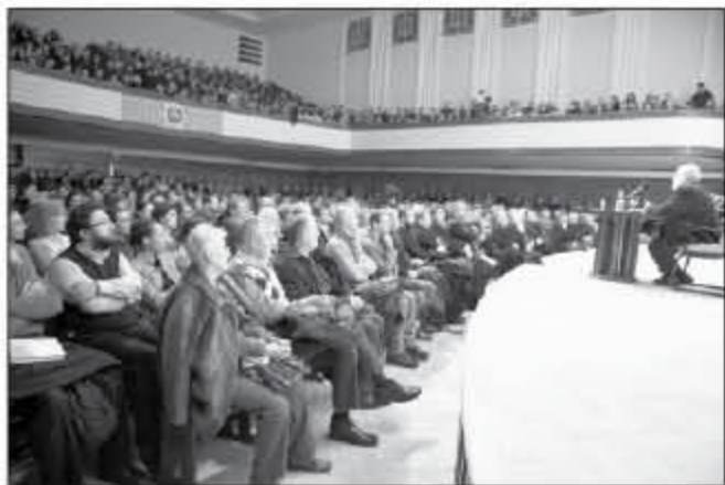
Andrei Pleșu conferențiază în sala Auditorium Maximum a Universității Babeș-Bolyai, 29 ianuarie

A n data de 29 ianuarie, începând cu ora 18, în sala Auditorium Maximum a Universității Babeș-Bolyai, la invitația Înaltpreasfințitului Mitropolit Andrei, domnul Andrei Pleșu a conferențiat pe tema ultimei sale cărți, Parabolele lui Iisus. Adevărul ca poveste , publicată în toamna anului trecut, volum care a fost desemnat „cartea anului 2012” de către Uniunea Scriitorilor din România.