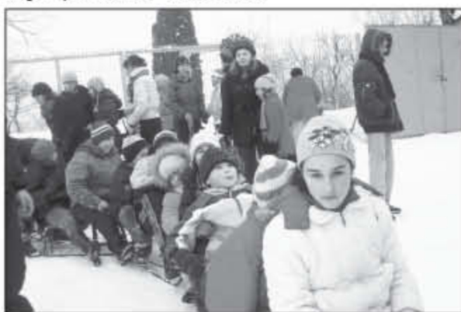
Copiii s-au bucurat cel mai mult de ieșirea la săniuş organizată de ASCOR Cluj

Veselia a durat în jur de două ore. La un moment dat, s-a făcut pauză de ceai. Unul dintre copii, din greșeală, a varsat lichidul cald pe haina altuia, dar cel ce a fost udat nu s-a supărat, zicând „Las' că iar se usucă!”. Prin gesturile firești și vorbele prietenoase copiii au oferit celor prezenți un exemplu de punere în practică a cuvintelor Mântuitorului: „De nu vă veți întoarce și nu veți fi precum pruncii, nu veți intra în Împărăția cerurilor” (Matei 18, 3).