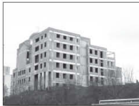
Noua Facultate de Teologie Ortodoxă Episcop Nicolae Ivan, în faza de construcție la roșu

5. Centrul de îngrijiri paliative „Sfântul Nectarie” din Cluj-Napoca. În anul 2012 au fost finalizate lucrările de construcție și executare a finisajelor interioare, zugrăveli, montat obiecte sanitare în băi, montat granit, gresie și faianță, sistem de securitate. S-a amenajat curtea cu pavele și s-a realizat gardul ș.a. Totodată s-a achiziționat mobilier, aparatură medicală și tehnică informatică.