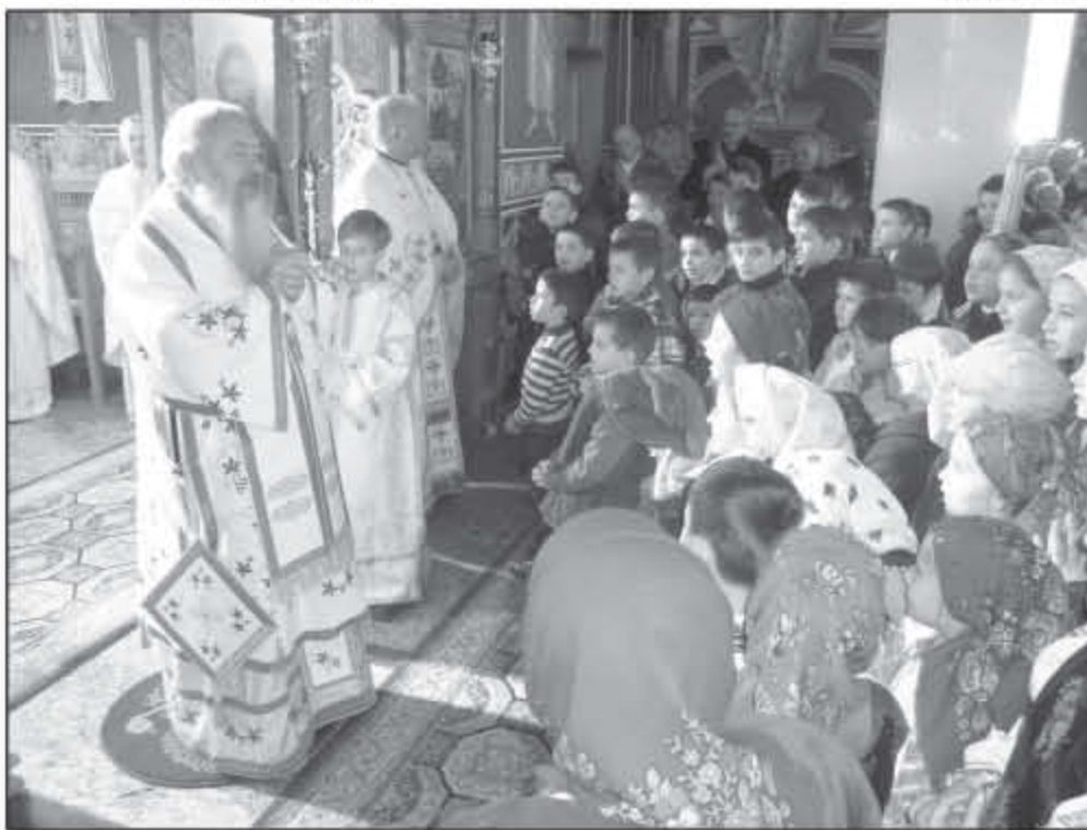
Sfânta Liturghie în biserica parohiei Feldru, protopopiatul Năsăud, 13 ianuarie 2013

16 Ianuarie: În Catedrala Mitropolitană slujește Acatistul Mântuitorului.