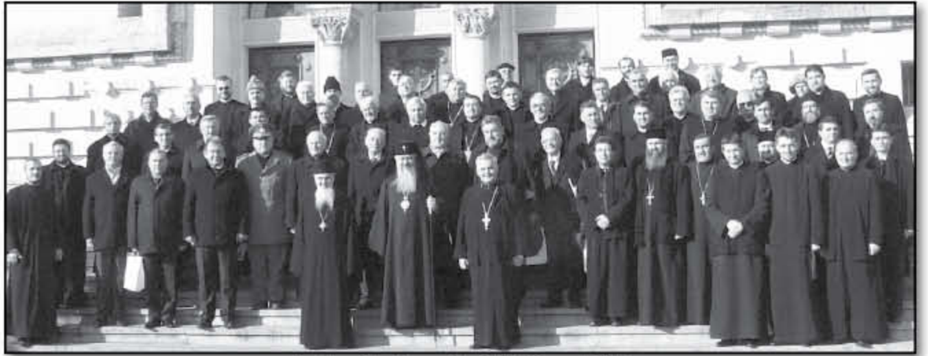
Participanți la Adunarea Eparhială, 26 ianuarie 2013

În anul 2012, în Arhiepiscopia Clujului erau în construcție sau reparații 100 de biserici și edificii bisericesti, în diferite stadii - de la fundație până la pictură, și au fost sfințite și resfințite 23 de biserici.