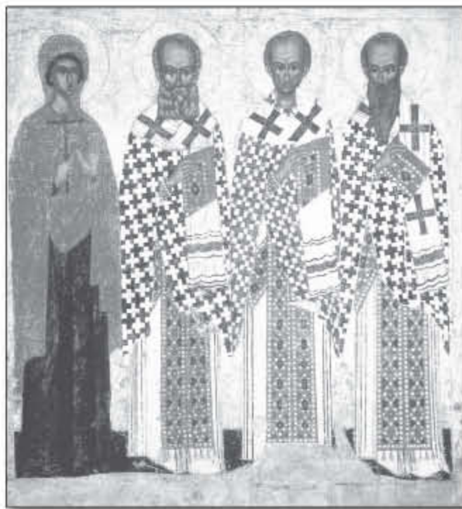
Sfânta Cuvioasă Parascheva și Sfinții Trei Ierarhi. Icoană din școala de la Pskov, începutul sec. XV, expusă în Muzeul Tretyakov din Moscova.

Pr. Liviu V.M.: Înaltpreasfinția voastră, ne apropiem de o temă destul de importantă, aceea a ecumenismului. Ecumenismul este o temă ce polarizează foarte repede interlocutorii constituindu-se într-unul din cele mai sensibile subiecte de discuție chiar între ortodocși. Ce părere aveți despre împărțirea ortodocșilor în conservatori și ecumeniști, tradiționaliști și filo-occidentali. E benefic un astfel de discurs?