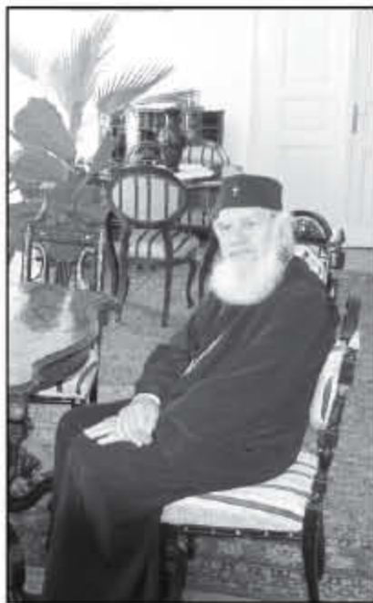
Mitropolitul Bartolomeu Anania

Despre Mitropolitul Bartolomeu se pot spune multe, dar dacă nu vorbim despre predicile lui la duminici, sărbători și la diferite evenimente, n-am spus aproape nimic. Ascultându-l pe părintele mitropolit vorbind la catedrală, la Nicula sau în altă parte te simțai în