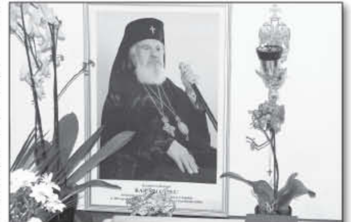
PS Mitropolit Bartolomeu Anania (18 martie 1921 - 31 ianuarie 2011)