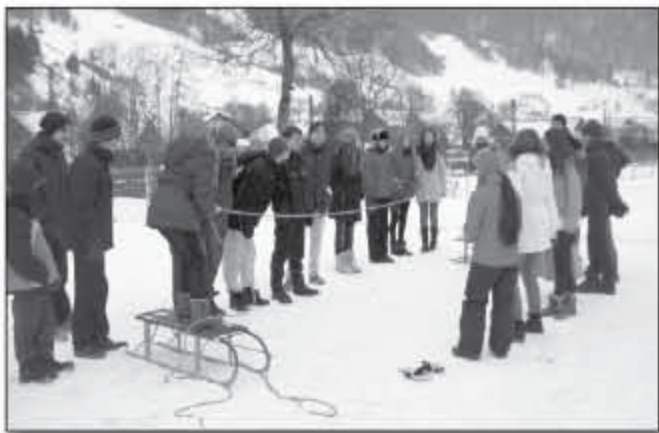
In cea de-a doua tabără de iarnă de la Mărișel, copiii au avut de înfruntat multe probe de foc

Serile se încheiau în ritmul cântecelor îndrăgite și interpretate de copii, fiind acompaniați de chitară. Iar atunci când se încălzeau cu o cană de ceai înainte de culcare erau anunțate și premiile zilei. Copilului cu un comportament deosebit, care era respectuos, prietenos, activ la jocuri, atent la discuții și prietenos cu ceilalți era desemnat Copilul Zilei . Iar cei ce reușeau să-și păstreze camera în curățenie s-au ales cu premiul Camera zilei .