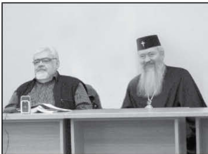
Întâlnirea domnului Andrei Pleșu cu teologii clujeni, 29 ianuarie, Aula Nicolae Ivan a Facultății de Teologie Ortodoxă din Cluj-Napoca