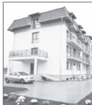
Centrul de Îngrijiri Paliative Sfântul Nectarie, Cluj-Napoca

C. Centrul de Îngrijire și Asistență pentru Persoane Vârstnice „Acoperământul Maicii Domnului”, Turda; D. Proiectul de Îngrijire la domiciliu „Sfântul Vasile cel Mare”, Cluj-Napoca; E. Tabăra pentru Copii „Valea Vadului”; F. Programul de