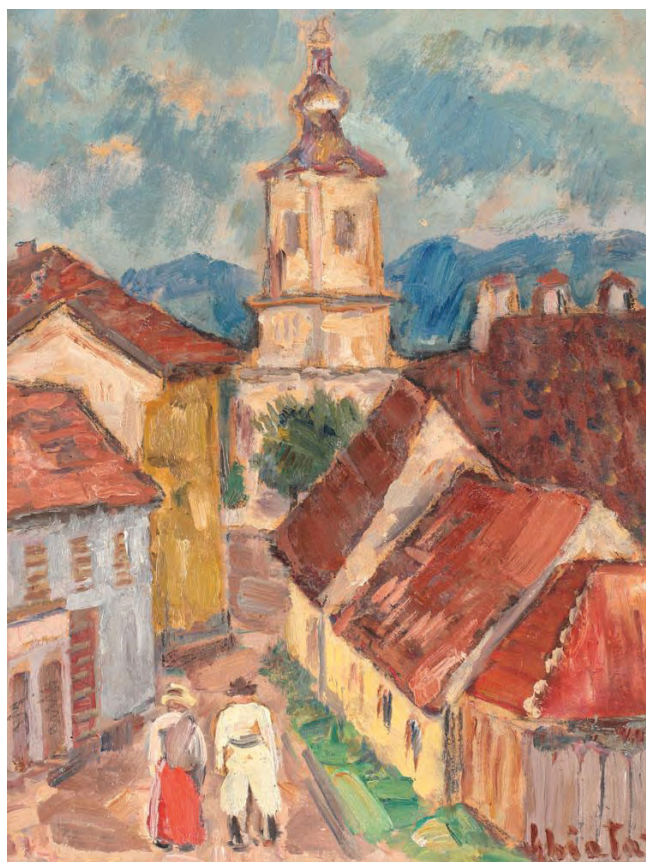
Sat ardelenesc, pictură de Dumitru Ghiață (1888-1972)