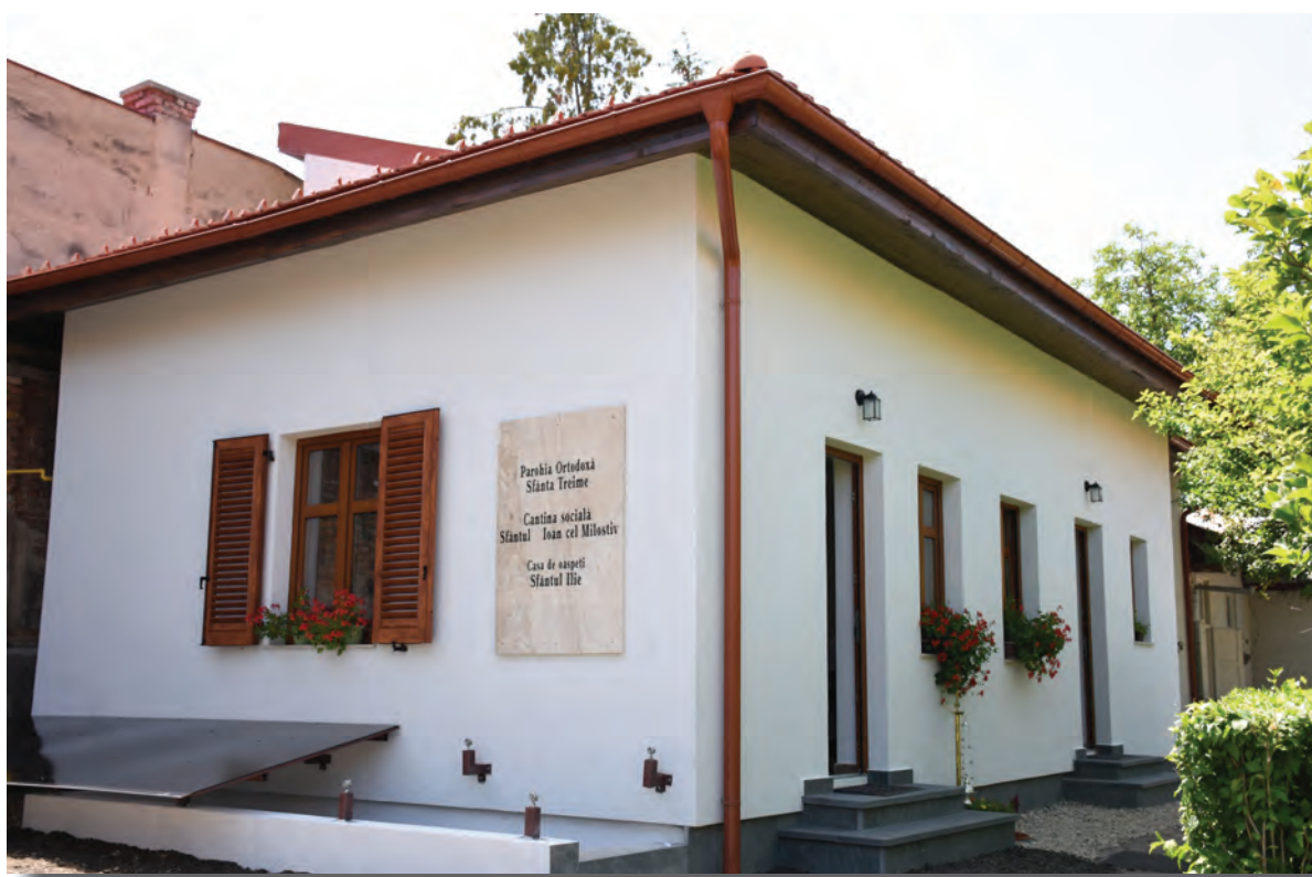
Cantina Socială Sfântul Ioan cel Milostiv și Casa de Oaspeți Sfântul Ilie Tezvitianul ale Parohiei clujene Sfânta Treime, "Biserica din Deal", din Protopopiatul Cluj II.

2) Casa de oaspeți „Sfântul Ilie” din Cluj-Napoca oferă găzduire temporară pentru însoțitorii bolnavilor cronici, pe perioada spitalizării sau a tratamentelor acestora în Municipiul Cluj-Napoca; În primul an de funcționare au fost cazați în mod gratuit 122 de persoane;