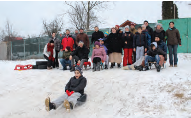
Alte activități ale ASCOR Cluj-Napoca în sesiune

Cât de fericit sunt că mi-ați dat prilejul să-mi mărturisesc dragostea despre Eminescu și fenomenul românesc.”