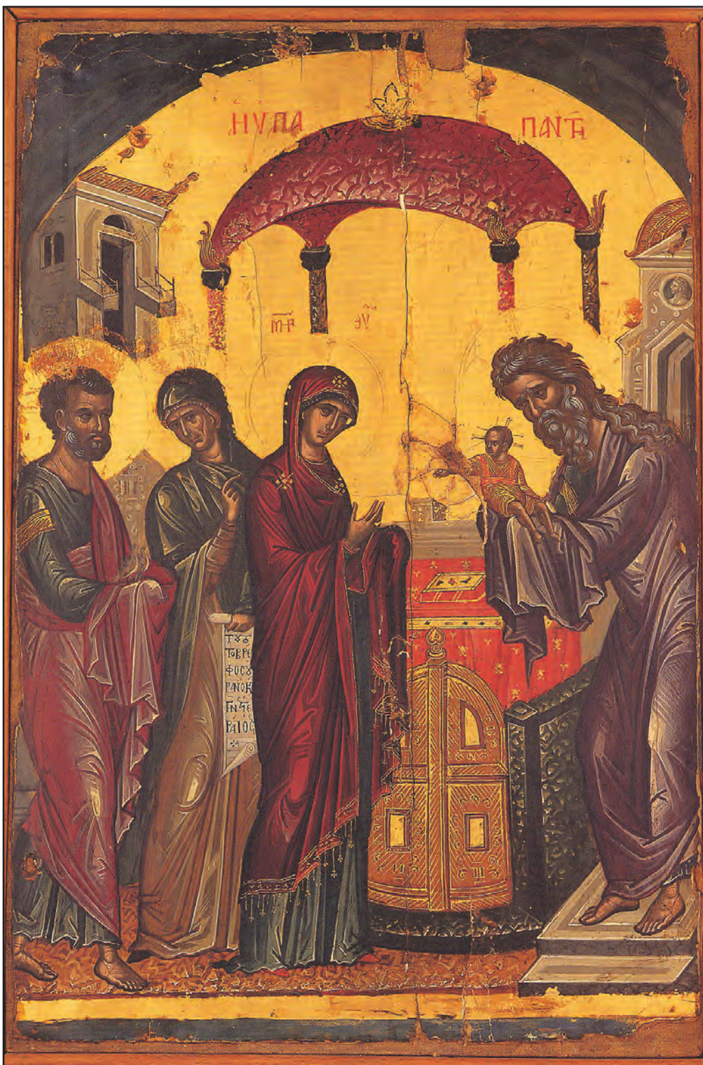
Întâmpinarea Domnului, Mănăstirea Stavronichita, Sfântul Munte Athos, 1546.