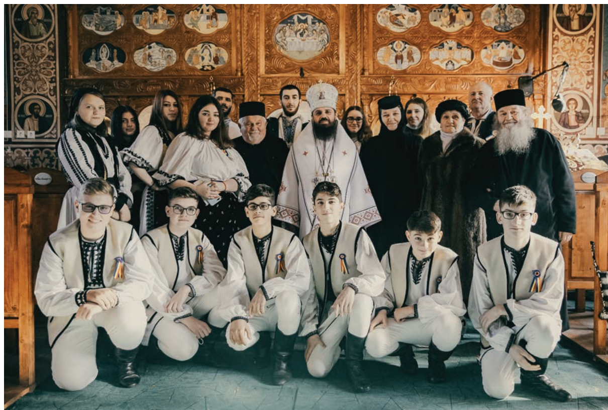
Preasfințitul Părinte Benedict Bistrițeanul, Episcop-vicar al Arhiepiscopiei Vadului, Feleacului și Clujului, în biserica Parohiei natale Sartăș, 7 ianuarie 2022.

În Duminica a XXIX-a după Rusalii săvârșește Sfânta Liturghie, în sobor de preoți și diaconi, la Catedrala Mitropolitană. Rostește predica, unde subliniază modul în care ar trebui să fim recunoscători lui Dumnezeu, dar și oamenilor, începând de la lucrurile mici, neînsemnate, ca apoi să putem mulțumi și pentru cele mari.