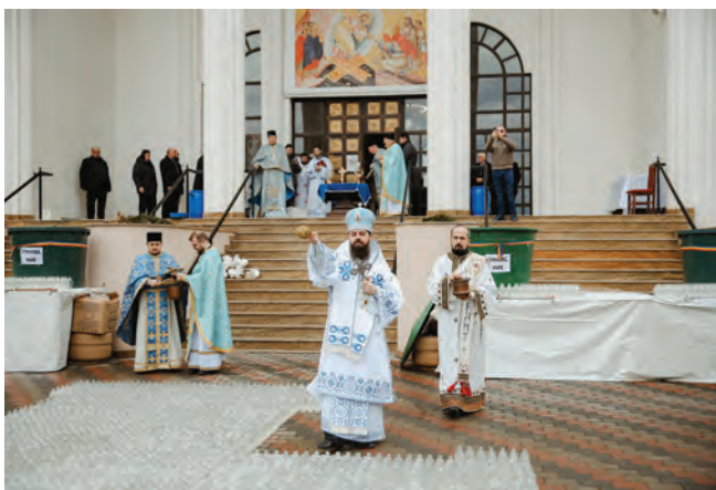
Preasfințitul Părinte Benedict Bistrițeanul oficiază slujba Aghiasmei Mari în fața bisericii Sfinții Apostoli Petru și Pavel din Cluj-Napoca în ziua praznicului împărătesc al Botezului Domnului, 6 ianuarie, 2024.

Face o vizită la Centrul de îngrijiri paliative „Sfântul Nectarie” din Cluj-Napoca. Oficiază slujba Parastasului pentru pacienții trecuți la Domnul în decursul lunii decembrie.