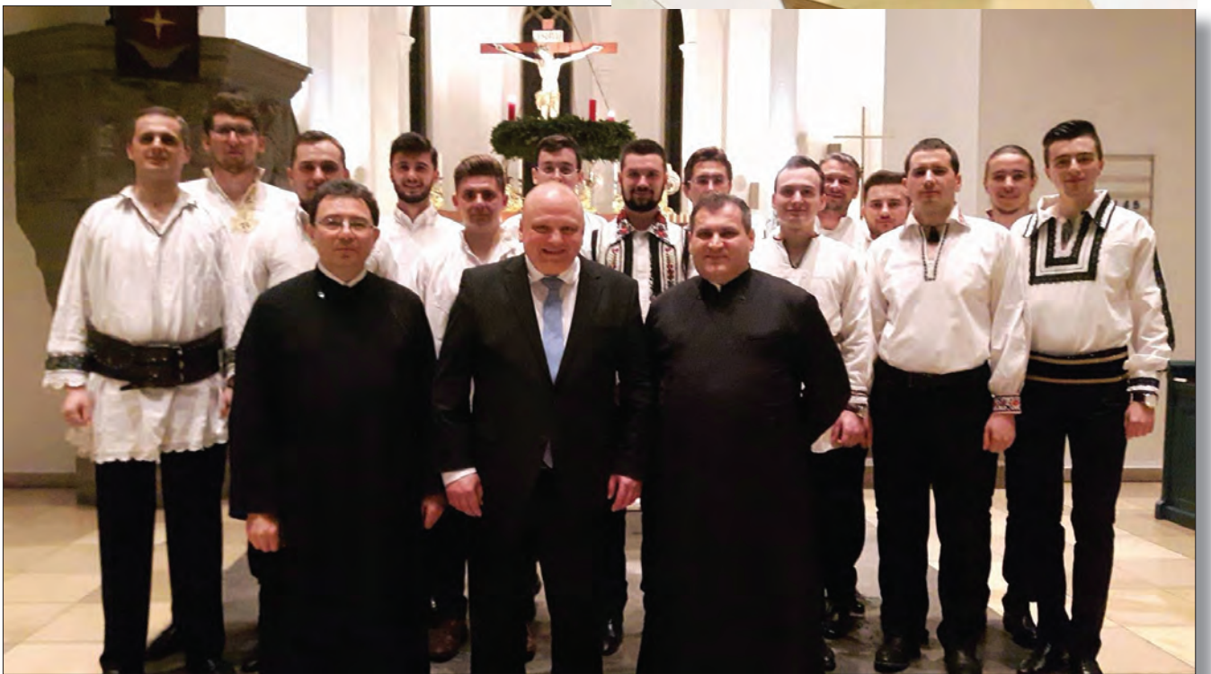
Alături de domnul Mathias Hartmann, rectorul Diakonie Neuendettelsau

Dacă privim crucea Diakonie, observăm reprezentate pe această cruce faptele milei trupești pe care Mântuitorul Iisus Hristos Le-a lăsat Bisericii ca model de raportare a noastră față de aproapele nostru și implicit față de Dumnezeu. A sătura pe cel flămând și a da să bea celui însetat, a primi în casă pe cel străin, a cerceta pe cel bolnav și pe cel din temniță și a îngropa pe cel mort, toate acestea țin de misiunea pe care noi o avem față de aproapele nostru. Mântuitorul, după cum relatează Evanghelistul Matei în capitolul 25, este foarte clar cu privire la aceste fapte. Trebuie ca în fiecare persoană să-L vedem pe Hristos: „Adevărat zic vouă, întrucât ați