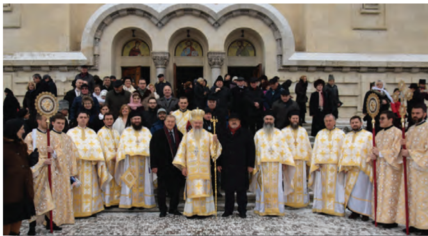
Înaltpreasfințitul Părinte Mitropolit Andrei în fața Catedralei Mitropolitane din Cluj, în ziua de Crăciun, 25 decembrie 2016.

10 decembrie: La Cinema Mărăști, participă la cea de-a 6-a ediție a Festivalului de Colinde „Episcop Nicolae Ivan”. Rostește