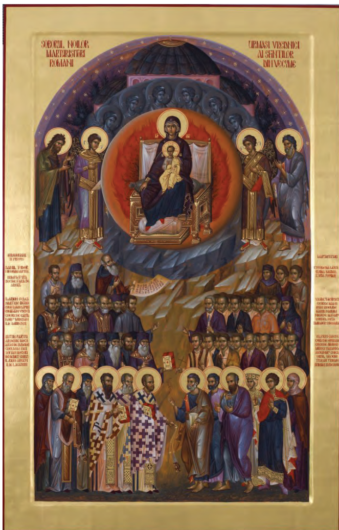
Soborul Noilor Mărturisitori Români, icoană dăruită Mănăstirii Petru Vodă de către Mănăstirea Vatoped din Sfântul Munte Athos.

Faptul că fenomenul detenției politice exterminatorii a început în România încă înaintea celui de al doilea război mondial, arată că lupta împotriva neamului românesc și a valorilor sale supreme, credință și dragostea de neam, era în planul „celui rău” de mult. Dar fenomenul detenției politice exterminatorii sub comunism a căpătat dimensiuni de masă.