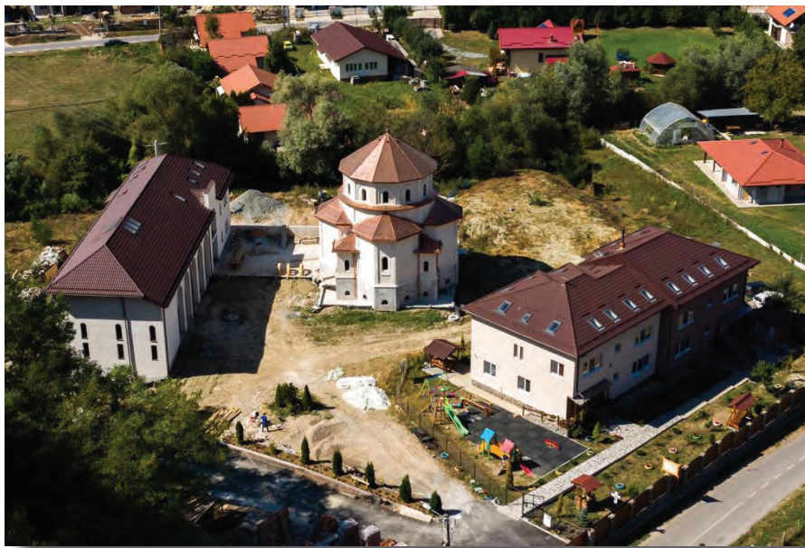
Așezământul Sfântul Onufrie pentru orfani, de la Mănăstirea Florești, Cluj.

După cuvântul Sfântului Apostol Pavel, care a zis: „Bucurați-vă cu cei ce se bucură, plângeți cu cei ce plâng” (Romani 12, 15), ar trebui ca inimile noastre să se întristeze pentru suferințele copiilor greu încercați de viață. Cum ne-am putea numi creștini, dacă ne-am îmbuiba de toate bunățile, în timp ce alții rabdă foame și frig? Sau cum am putea să cerem ajutorul Tău, de nu-i vom ajuta la rândul nostru pe cei ce au nevoie de ajutor? „Luminează-ne pe noi, Doamne, să-i ajutăm cu ce ne stă în putință, ca să îndulcim măcar puțin amara lor viață. Bindecuvintează-i, Doamne, pe acești copii necăjiți și pe cei care îi ajută pe ei, întărește-i și le răsplatește lor după mare mila Ta, ca un bun și iubitor de oameni” 4 .