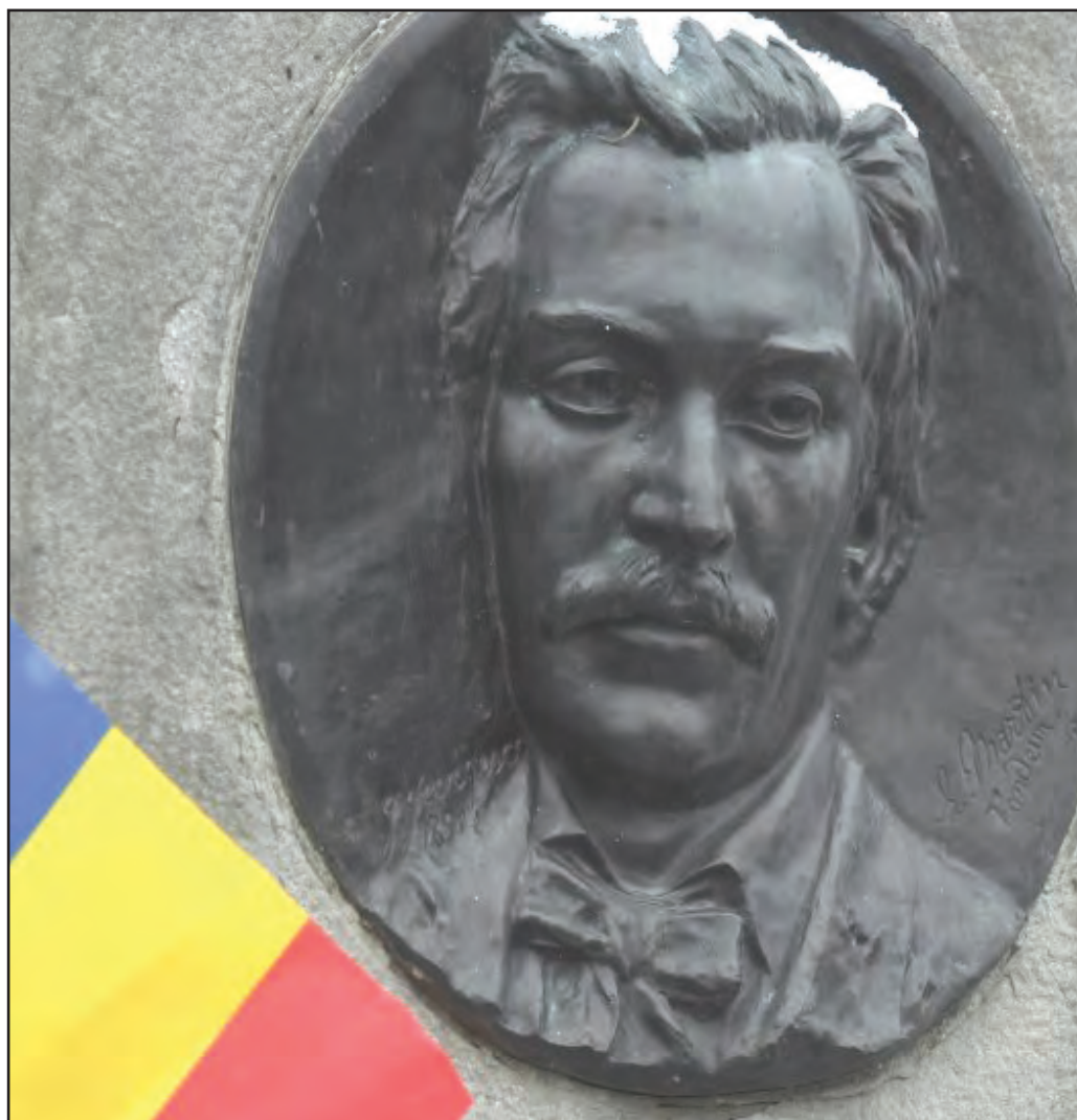
Poetul național Mihai Eminescu (1850-1889)