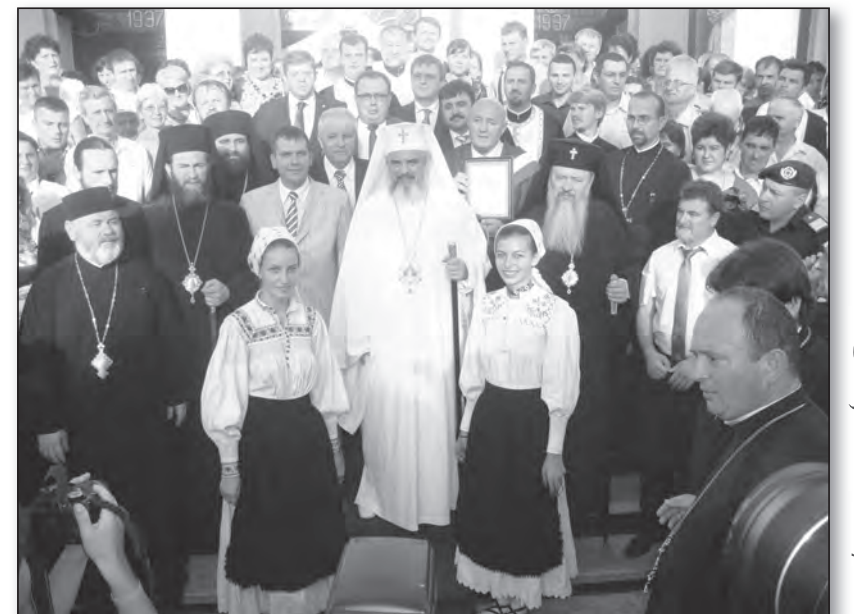
„Catedrala” din Sat-Mare

Au fost trei zile minunate, trei zile încărcate de emoție și sfințenie, zile care vor rămâne întipărite în mințile și inimile minunaților credincioși din nord-vestul țării și, de ce nu, în mințile și inimile noastre, ale celor care le-am fost alături.