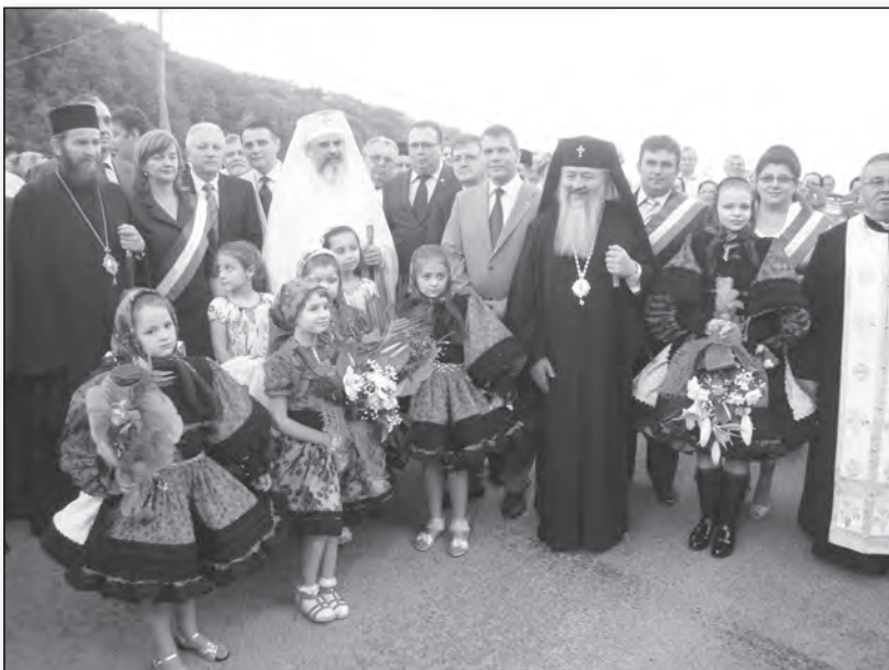
Primirea la intrarea în Țara Oașului

Trecând prin satele de pe Valea Izei, unde lumea era adunată în fața bisericilor pentru a saluta și a aduce un omagiu de bun venit oaspeților, admirând frumusețea satelor și a bisericilor din zonă, fiind copleșiți de minunăția costumelor