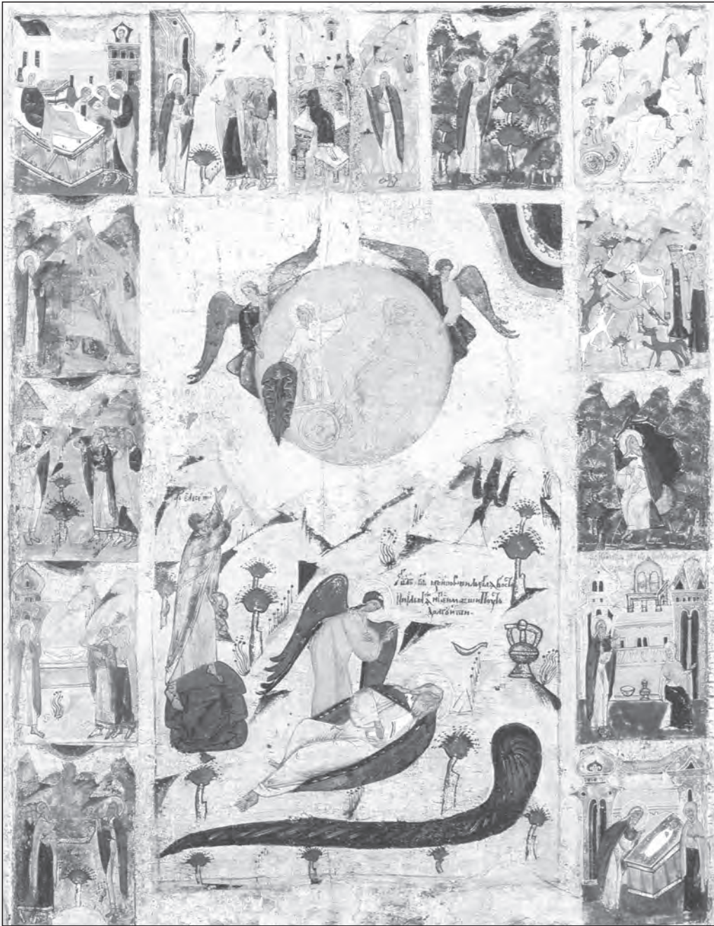
Profetul Ilie cu carul de foc, sec XVII