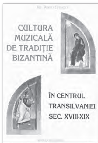
PR. PETRU STANCIU, Cultura muzicală de tradiție bizantină în centrul Transilvaniei sec. XVIII-XIX , Ed. Renașterea, 2010, 301 p.

De câțiva ani buni observăm că s-au înmulțit cărțile și studiile cu profil muzical-teologic. Mai mult, în unele centre universitare precum Iași, Cluj-Napoca, Timișoara, Sibiu, Craiova etc., organizarea periodică de sesiuni științifice naționale, simpozioane, prin dezbaterile specialiștilor, se identifică încă noi perspective atât în direcția investigațiilor aplicate repertoriului psaltic cântat, în general, cât și în cel de înzestrare a stranelor noastre cu noi și folositoare cărți liturgice și de repertoriu coral.