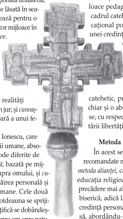
Inscripție: Această [sfântă] cruce au plătit Chișu Petre din Suat ca să le fie dumisale și soțul [dumi]sale Măcinică și la tot neamul să le fie pomană. Văleatul 1770, Dumitru Zugravul. Muzeul Mitropoliei Clujului, Maramureșului și Sălajului

„Profesorul de Religie” este prima pagină dedicată exclusiv cadrelor didactice din Școlile și Liceele Județelor Cluj și Bistrița-Năsăud. În ea se reflectă activitățile, proiectele și preocupările științifice ale profesorilor de religie. Așteptăm articolele dumneavoastră la adresa revista@renasterea-cluj.ro sau liviuvidican@yahoo.com .