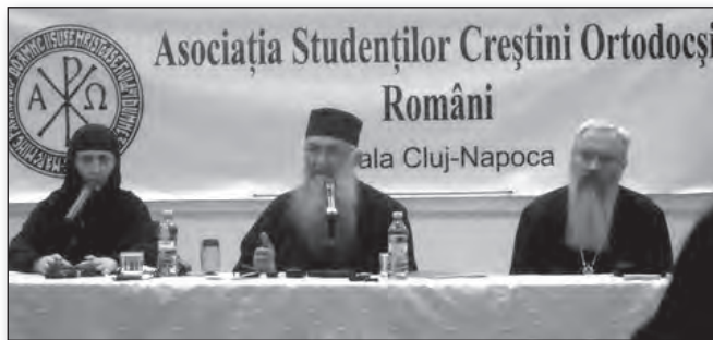
Părintele Zaharia Zaharou a împărțit daruri duhovnicești și povești de mare folos clujenilor nerăbdători să soarbă din învățătura pe care a lăsat-o Sfântul Siluan ucenicilor săi

Aceste cuvinte au însuflețit inimile și voința celor prezenți la conferință; totuși, în așteptarea lor rămânea nerostită ideea că dobândirea Harului lui Dumnezeu cere parca o muncă specifică din partea omului. Și întrebările s-au rostit până la urmă: „cum să facem față lumii de astăzi?”, „pentru ce trăim? care este scopul vieții noastre?”, „cum să-L cunoaștem pe Dumnezeu?”, „câci Sf. Simeon Noul Teolog ne spune foarte categoric să nu ne amăgim, căci cine nu-L cunoaște pe Dumnezeu în această lume, nu îl va cunoaște nici în cealaltă. Răspunsul părintelui a fost neașteptat de simplu: „cine sunt eu să judec cuvintele unui sfânt?”; să nădăjduim; să cinstim pe fiecare om drept chipul lui Dumnezeu; cei care renasc în Duhul Sfânt