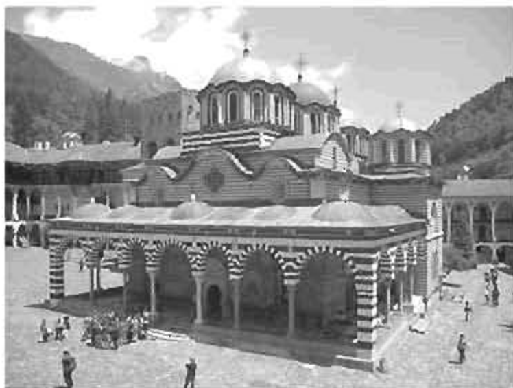
Mănăstirea Rila, Bulgaria