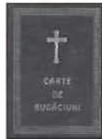
CARTE DE RUGĂCIUNI PENTRU FOLOSUL ORICĂRUI CREȘTIN (SCRIS NORMAL) (varianta IPS Andrei Andreicuț) interior la 2 culori, coperta tare, neagră 350 pag., format 110x145 mm. Preț 15 LEI.