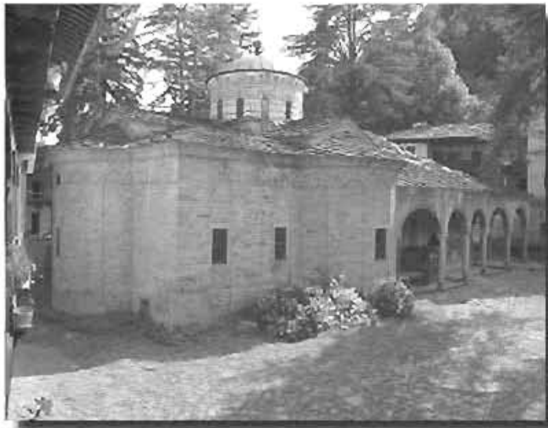
Mănăstirea Troyan, Bulgaria

Astfel, fiind ziua hramului, slujba a început mai târziu decât de obicei. La ora 9.00 a avut loc întâmpinarea ierarhilor, după care, în jurul orei 9.45, a început Sfânta Liturghie, aceasta fiind săvârșită de un sobor de ierarhi, preoți și diaconi, în