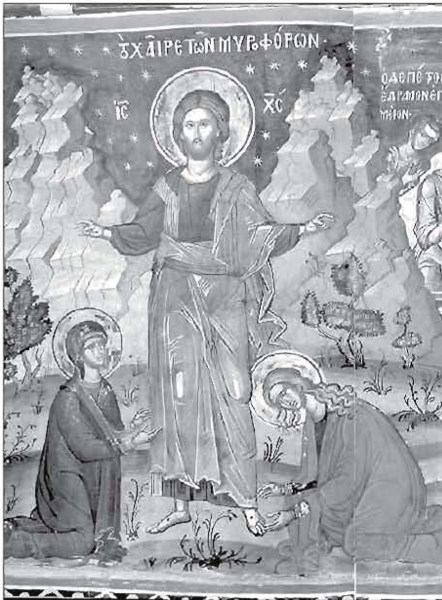
Maica Domnului și Maria Magdalena la picioarele Mântuitorului înviat frescă katolică, Mănăstirea din Divonisaia, sec. XVII. Sfântul Munte Athos.