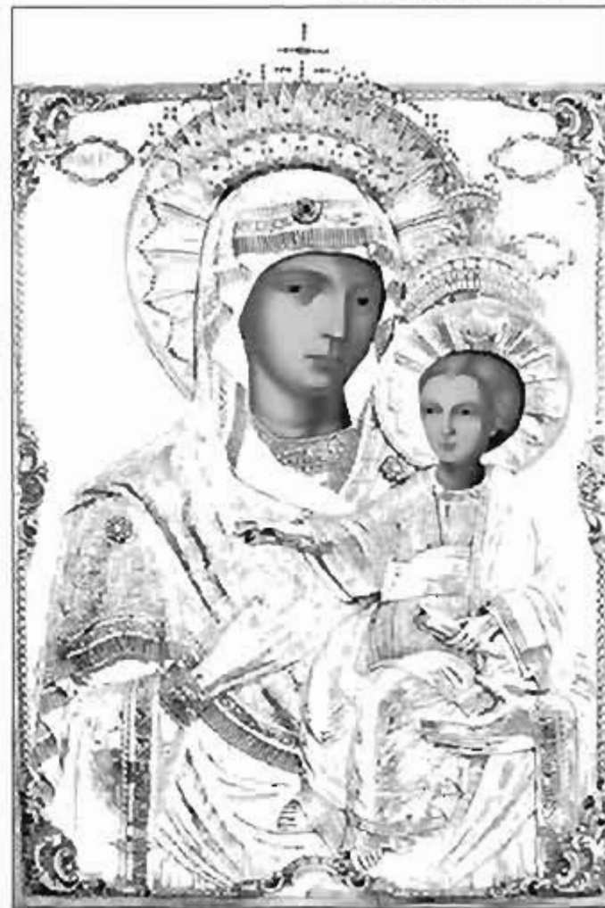
Icona Fecioarei de minuni a Maicii Domnului denumită Prodromița, nefăcută de mână, de la schitul românesc Prodromu din Sfântul Munte Athos, sărbătorită în data de 12 iulie

Schimbarea formulei vechi în „miluiește-ne pe noi” s-a făcut fără probleme deosebite pentru că cei ce psalmodiau