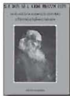
PĂRINTELE GEORGES FLOROVSKY. SCHIȚĂ BIOGRAFICĂ 282 pag., format 145x210 mm Preț: 15.00 Lei

S-A DUS SĂ-L VADĂ PRECUM ESTE 20 de ani de la mutarea în eternitate a părintelui Sofronie Saharov 471 pag., format: 135x200 mm Preț 30 LEI.