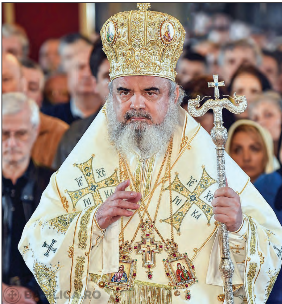
† Preafericitul Părinte Daniel, Patriarhul Bisericii Ortodoxe Române