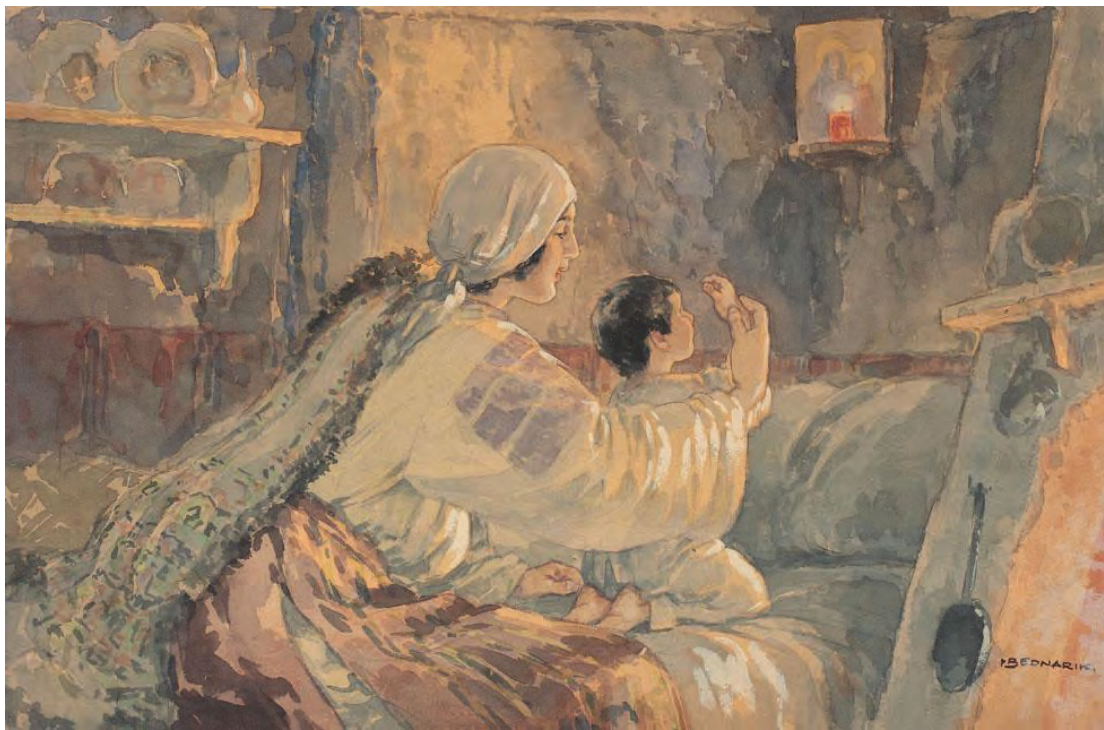
Rugăciunea de seară. Acuarelă și tempera pe carton de Ignat Bednarik (1882–1963), 34,5 x 49,5 cm.

Din toamna acestui an, profesorii de religie din întreaga țară vor avea acces la materialele din această Platformă. Datorită generozității și muncii asidue, depuse de acești oameni inimoși, o țară întregă va beneficia de roadele acestei strădanii. Acești oameni, au lucrat cu timp și fără timp, în aceste trei luni, pentru a sprijini munca a mii de profesori din întreaga țară, pentru a apropia elevii, și mai mult de disciplina religie, prin această modalitate virtuală, plăcută și atractivă, dar și pentru a sprijini Biserica neamului românesc. Chiar dacă, din toamnă, învățământul clasic ar reveni la normal, această Platformă va rămâne valabilă și absolut necesară. Din feedback-urile primite de la elevii din întreaga țară, cărora li s-au distribuit o parte din aceste formulare și exerciții, în ultimele două luni din anul școlar, ce tocmai a trecut, am constatat plăcuta impresie pe care au avut-o aceștia vis-à-vis de această modalitate de a face religia, care, cu toate că rămâne fidelă tradiției, este diacronică și se adaptează oricăror timpuri și oricăror vremuri.