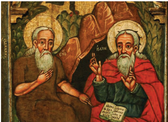
Sfinții Enoh și Ilie.