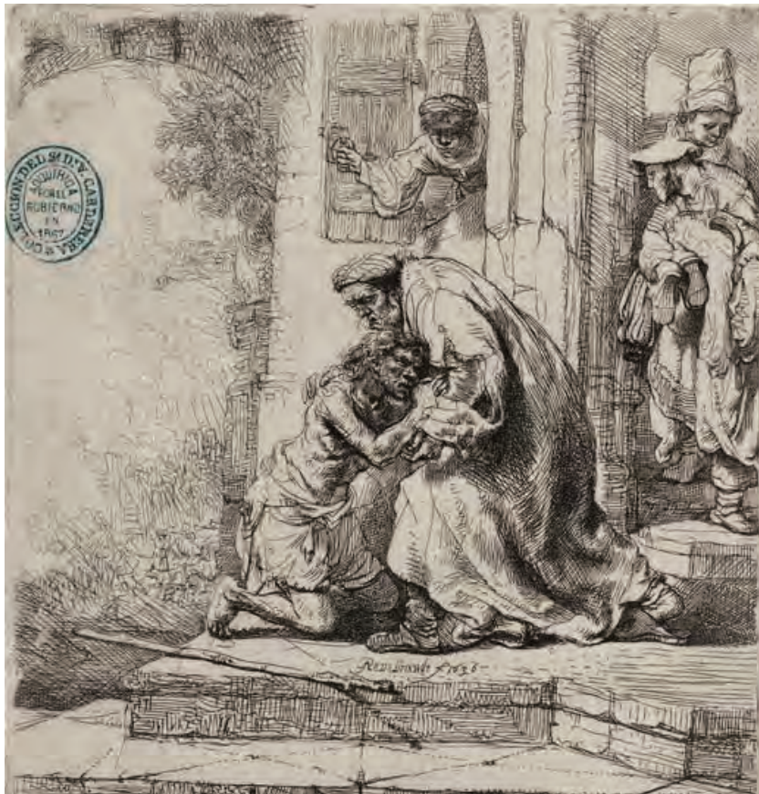
Fiul Risipitor. Gravură de Rembrandt Harmenszoon van Rijn (1606-1669).

Dorul după „acasă” se intuieste în cazul amândurora. Și deznodământul ar putea fi fericit pentru amândoi, de vreme ce finalul povestirii este deschis. Tatăl iese în întâmpinarea feciorului cel mic, dar face același lucru și cu feciorul cel mare. Atâta timp cât avem un tată și o casă părintească cu porțile deschise, înseamnă că mai sunt șanse să fim reprimiți înăuntru sau să ne simțim nu doar în casă, ci și acasă...