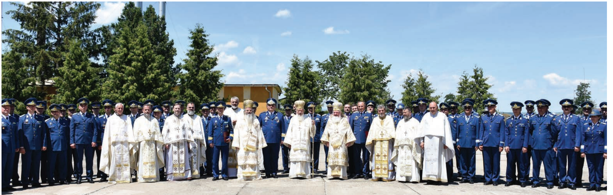
IPS Părinte Arhiepiscop și Mitropolit Andrei, înconjurat de PS Părinte Ignatie și PS Părinte Varlaam Ploieșteanul, a oficiat slujba de resfințire a Capelei din incinta Bazei 71 Aeriană din Câmpia Turzii, 16 iunie, 2022.

Conduce, pe străzile din centrul municipiului Cluj-Napoca, îndătinata Procesiune de Rusalii. La final, în fața Catedralei Mitro-