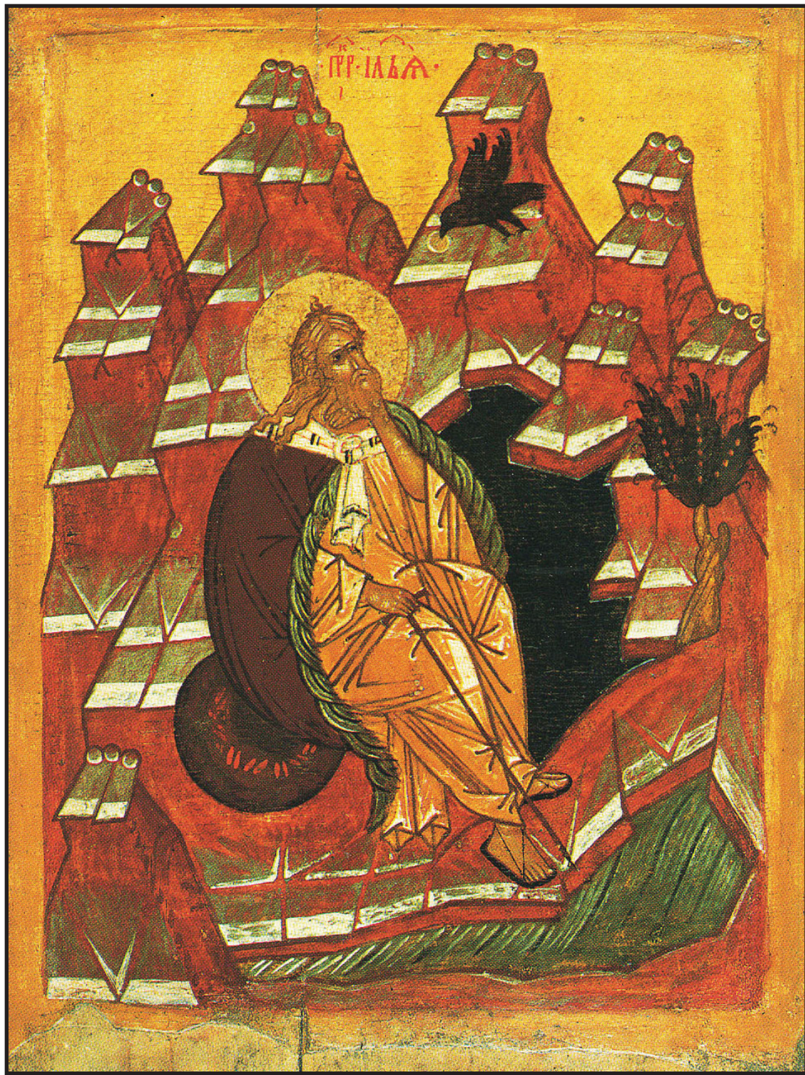
Sfântul Prooroc Ilie. Icoană portabilă din secolul XV, Petrozavodsk, Muzeul de artă din Carelia.