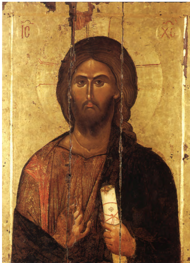
Iisus Hristos Pantocrator, Icoană pe lemn (118 x 89 cm) din secolul XIII-XIV, de origine probabil constantinopolitană, aflată în sala de Sinaxe a Sfintei Mari Mănăstiri Vatoped din Sfântul Munte Athos.

În acest context, Iisus exclamă: „Dacă Mă slăvesc Eu pe Mine Însuși, slava Mea nimic nu este. Tatăl Meu este Cel Ce Mă slăvește, despre Care voi ziceți că e Dumnezeuul vostru. Și voi nu L-ați cunoscut, dar Eu Îl știu; și dac-aș zice că nu-L știu, aș fi asemenea vouă, un mincinos. Dar Eu Îl știu și-I păzesc cuvântul” (In. 8, 54-55). Din aceste cuvinte, cel puțin asupra unui lucru Iisus este de acord cu potrivnicii Săi: „Dacă Mă slăvesc Eu pe Mine Însuși, slava Mea nimic nu este.” Iisus se dezice de orice laudă de sine, care nu este „nimic”, nici printre oameni, și nici înaintea lui Dumnezeu, care o și osândește (cf. Mt. 23, 12; 1 Pt. 5, 5). Într-o altă împrejurare, Iisus afirmă categoric acest adevăr: „Cel care găsește de la sine își caută propria lui slavă; dar Cel Care caută slava Celui Ce L-a trimis, Acela este adevărat, și nedreptate într-Însul nu se află” (In. 7, 18). Autenticitatea cuiva rezidă, așadar, în propria lui smerenie!