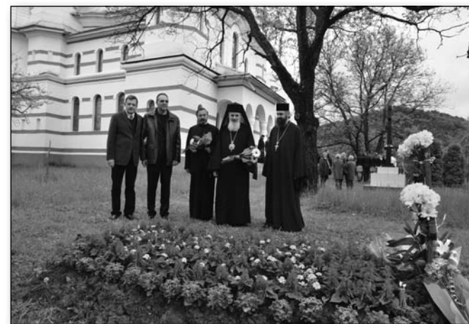
La mormântul maestrului Constantin Pavel, mai 2011

I mpul nu plecă niciodată fără bagaje mari. Tărăște după el nume și fapte care cândva erau mituri. După ani sau zeci de ani de tăcere, te întrebi unde au dispărut atâția oameni care promiteau sau chiar au devenit monștri sacri. Am avut actori mari care s-au stins, dar avem și actori care s-au izolat, au emigrat sau au renunțat la carieră din motive misterioase. Lipsa de preocupare a autorităților din cultură pentru soarta lor i-a aruncat într-o umbră sufocantă și se pare definitivă.