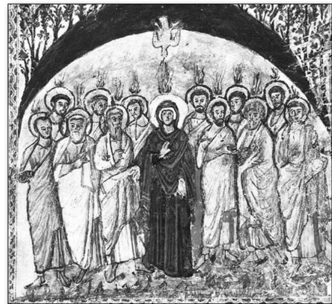
Evanghelia lui Rabula, Pogorârea Sfântului Duh, miniatură, tempera pe hârtie, sec. al VI-lea, Biblioteca Laurențiană, Florența

Binecuvântat ești, Hristoase, Dumnezeu nostru, Cea ce preamînțelepți pe pescari i-ai arătat, trimițându-le lor Duhul Sfânt; și printr-înșii lumea ai vânat, Dătătorule de viață, slavă Ție! 14