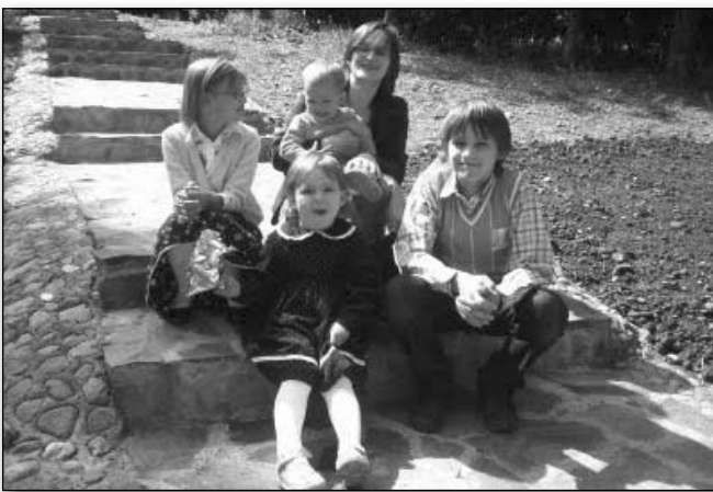
Mama cu cei patru copii minunați – familia Manea

De vremuri, în urmă cu foarte mulți ani, mai scriam câte ceva pentru foaia noastră de suflet, „Filocalia”, mai redactam câte-o știre, cronica vreunui pelerinaj, mai făceam câte o traducere, mai scriam câte-o poezie, câte-un eseu despre mântuire... ce multe s-au schimbat de-atunci.