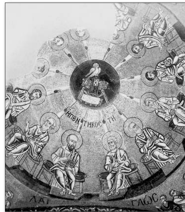
Pogorârea Sfântului Duh, mozaic, sec. al XII-lea, Biserica Osios Lukas, Focida.

Elementele decorative sunt dispuse într-un chenar ce mărginește scena; în cele două unghiuri superioare lăstate de desfășurarea bolții putem observa ritmul ascendent de verticale ce prin arbuști cu frunze de albastru și verde conduc privitorul spre ideea de mișcare și creștere ca o paralelă la siluetele limbilor de foc și ale trupurilor Apostolilor.