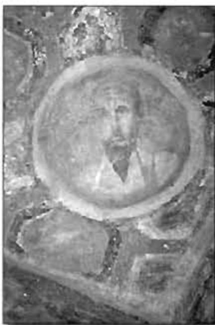
Sfântul Pavel, Bunul Păstor, frescă, sec. al IV-lea, catacomba Sfintei Tecla, Roma.

În iconografie, reprezentările lor coboară până în veacul al II-lea și al III-lea. În acest sens, amintim o medalie romană de la Muzeul Vaticanului în care cei doi sfinți sunt redați față în față. Preluând tipologia compoziției și a figurilor într-un basoreliev de la Aquileia, creatorul surprinde cu realism portretele lor, ce reproduc chipuri executate, fără îndoială, din observație directă. Aceleași trăsături se pot observa și pe peretele unui cubicul din secolul al III-lea, aflat în Catacomba Sfinților Petru și Marcellinus din Roma. Cea mai veche frescă a Sfinților Apostoli Petru și Pavel a fost descoperită în catacombele Sfintei Tecla, din sudul Romei. Această reprezentare datează din secolul al IV-lea și a fost scoasă la iveală pe 19 iunie 2009, datorită lucrărilor de restaurare într-o nișă (cubiculum) - o cameră mortuară - se crede a fi mormântul unei nobile femei romane. Catacombele Sfintei Tecla sunt situate la o distanță de 500 de metri de Basilica San Paolo fuori le Mura (Catedrala Sfântului Pavel în afara zidurilor), unde este și mormântul Sfântului Pavel. Fresca are în centru Bunul Păstor, iar în cele patru colțuri ale plafonului patru portrete, pe care arheologii le-au identificat ca fiind cele ale Sfinților Petru, Pavel, Andrei și Ioan. Astfel, o multitudine de mijloace și tehnici artistice îi redau atât în spațiul monumental eclezial, cât și în icoane portabile, statui, ronde-bosse-uri, medalii, tapiserii, vitralii, ori picturi religioase.