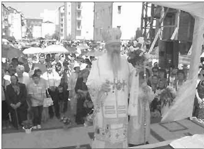
Sfânta Liturghie la biserica cu hramul „Sfântul Gheorghe” din Bistrița, 6 mai 2013.