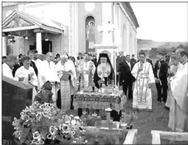
PS Vasile Someșanul, în Urișor, după Sfânta Liturghie din 26 mai, 2013.

1 Mai: Oficiează Sfântul Maslu în biserica „Sfântul Dimitrie Basarabov” din Cluj-Napoca.