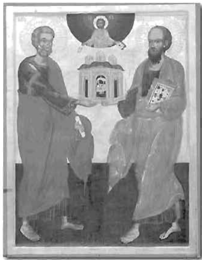
Sfinții Apostoli Petru și Pavel, ținând o biserică în mâini, icoană contemporană.

Așezarea lor într-un singur spațiu și mai cu seamă expresia lor transfigurată, de o rară profunzime nu rămâne doar o capodoperă a artei universale; mesajul este creștin cu precădere, circumstanța lor ne îndeamnă la cugetare, comuniune, rugăciune, smerenie și unitate a credinței.