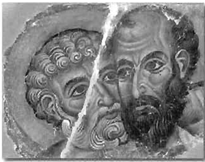
Sfinții Apostoli Petru și Pavel, frescă, sec. al XII-lea, Mănăstirea Vatopedou, Sfântul Munte Athos.