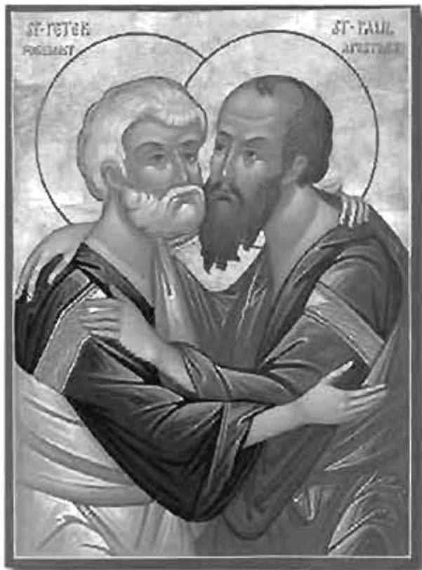
Sfinții Apostoli Petru și Pavel, icoană contemporană.

În icoana cretană, ce cu siguranță aparține sfârșitului de veac al XVI-lea, artistul ni-i înfățișează bust. Ei sunt așezați într-o poziție analogă celei prezentate înainte, doar că în acest caz Apostolul Petru este zugrăvit mai sus. Privirea lor pare să fie mai concis îndreptată unul către altul. Sfântul Petru, înveșmântat într-o tunică albastră, poartă un himation verde deschis. Cu mâna dreaptă îl susține pe Sfântul Pavel. Apostolul Neamurilor, cu tunica identică, are pe deasupra lui un himation roșu violet 2 . Într-un gest similar, are mâna stângă ridicată pe umărul mai vârstnicului Petru. Ambii sfinți se îmbrățișează frățește, ținând la rândul lor mâinile la gâtul celuilalt. Simetria imaginii iconice, fondul de aur, atitudinea irină, expresia blajină, plină de noblețe, constituie elementele constitutive ale icoanei.