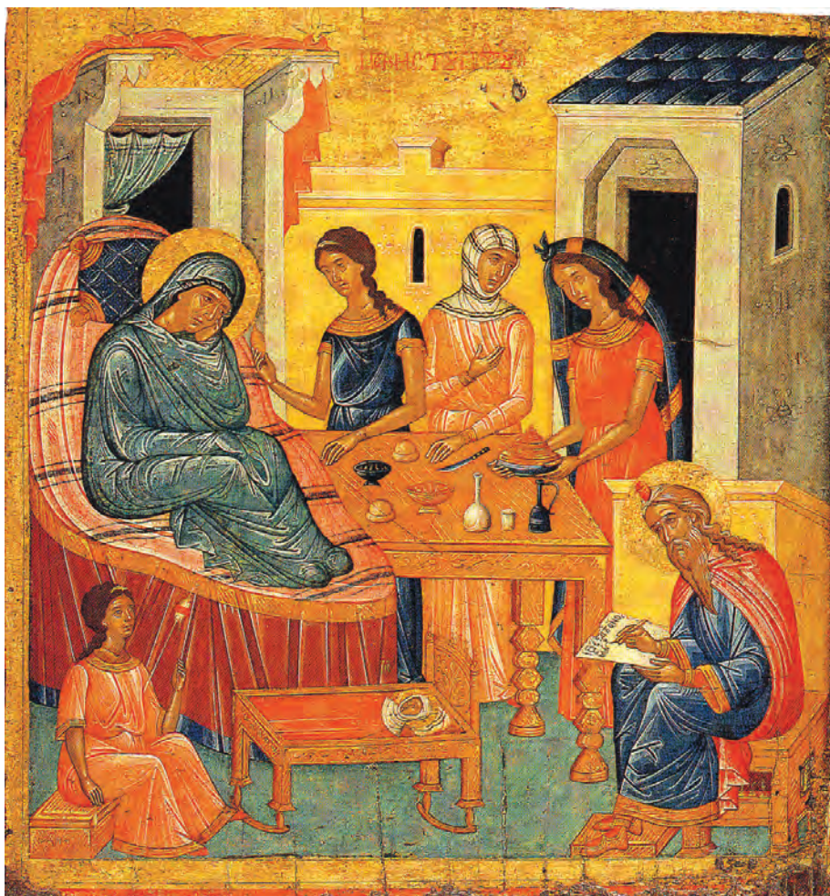
Nașterea Sfântului Ioan Botezătorul, icoană pe lemn (63,5 x 61,5 cm), a doua jumătate a sec. XV.