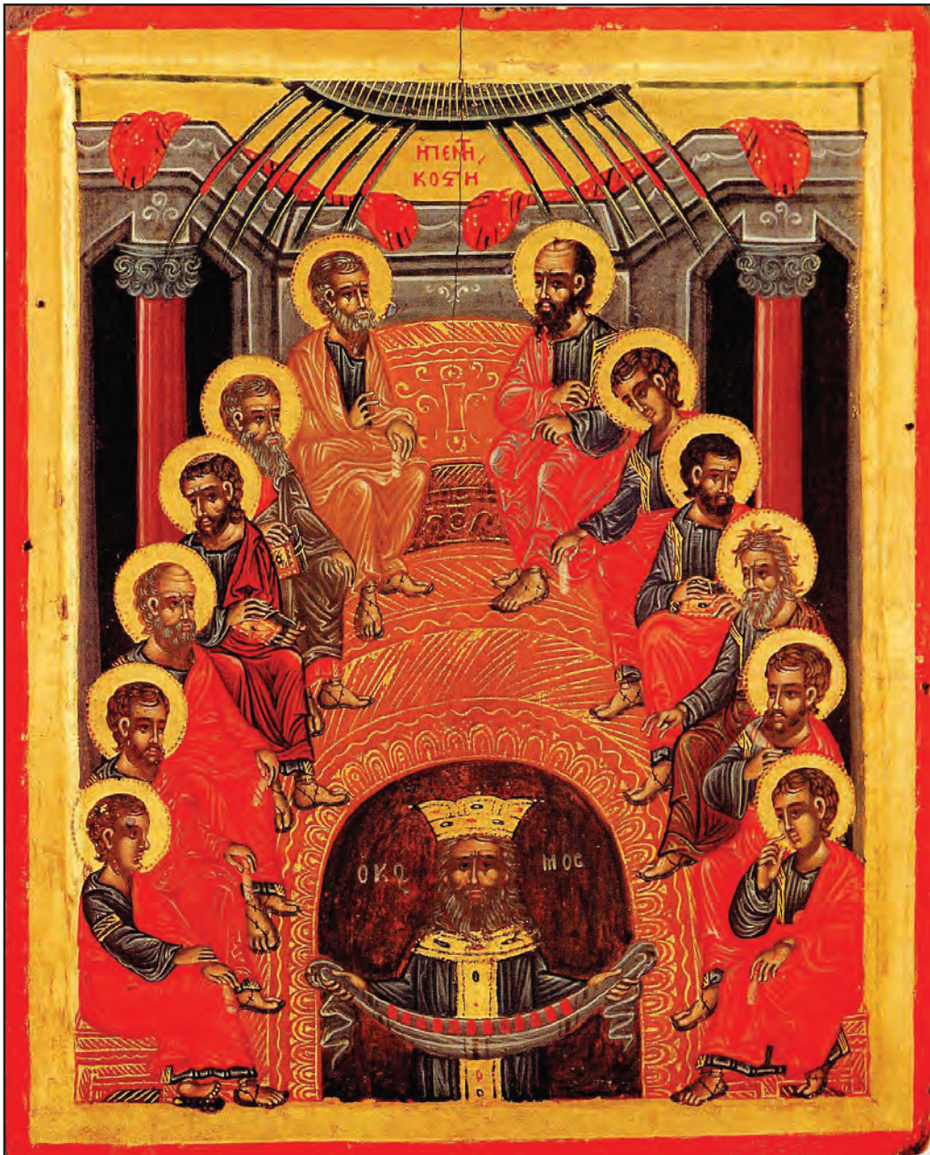
Pogorârea Sfântului Duh, icoană pe lemn de la Protaton, Sfântul Munte Athos.