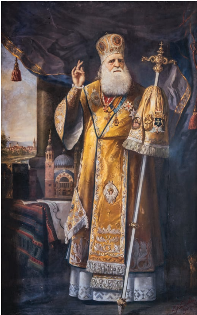
Mitrop. Andrei Șaguna, Ludwig Kandler, Săliște, 1904

1808/1 ianuarie 1809 în familia negustorilor macedo-români, Naum și Anastasia Șaguna, Anastasiu Șaguna a avut parte de o educație aleasă începând de acasă, mai ales datorită mamei sale 3 , trecând apoi prin gimnaziul piarist din Pesta, continuând cu studiile superioare de drept și filosofie la Universitatea din Pesta și desăvârșindu-se cu cele teologice la Institutul Ortodox al Episcopiei Vârșetului și în mănăstirile sârbești din Banat și Voivodina. Crescut și format intelectual în această ambianță cosmopolită a Pestei și în mediul provincial bănățean de la începutul secolului al XIX-lea, Andrei Șaguna a dat dovadă pe întreaga durată a vieții de o deschidere culturală remarcabilă, bogatului său orizont fiind îmbogățit prin călătoriile, prietenii și responsabilitățile sau ascultările sale în cadrul Mitropoliei Carlovițului. Biblioteca sa (circa 6.000 de volume și zeci de titluri de periodice de presă), lucrările sale (teologice, istorice și canonice) și bogata sa corespondență (peste 6.000 de scrisori conservate în Arhiva Mitropoliei Ardealului) ni-l descoperă în deplina sa anvergură de ierarh cărturar și abil diplomat, cu un pronunțat caracter poliglot, vorbind și scriind fluent în patru limbi: românește, maghiară, germană și sârbește, la care se adaugă limbile clasice greacă și latină, slavona bisericească, iar în ultima parte a vieții s-a străduit să învețe ebraica și franceza.