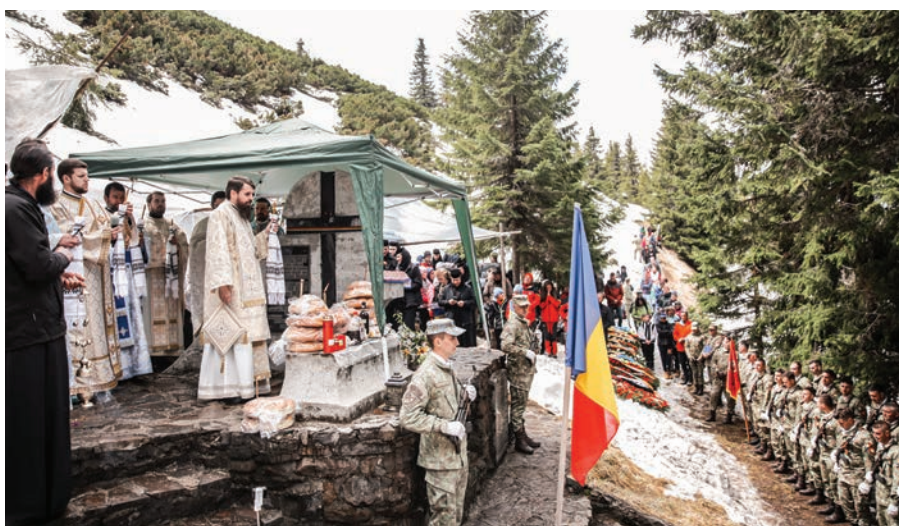
Preasfințitul Părinte Benedict Bistrițeanul, oficiind Sfânta Liturghie cu prilejul praznicului Înălțării Domnului, la Monumentul Eroilor de pe Vârful Grui din Munții Călimani. 25 mai, 2023.

Înregistrează o emisiune pentru Radio Doxologia dedicată Anului omagial al îngrijirii vârstnicilor, moderată de Protos. Maxim Morariu, Exarh al Episcopiei Ortodoxe a Canadei.