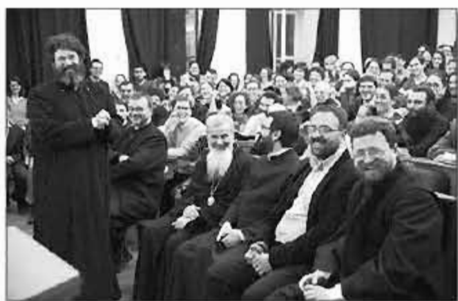
După 20 de ani, generația de aur ASCOR s-a reunit pentru a da mărturie despre existența unei prietenii de nezdruccinat care dăinuiește în timp