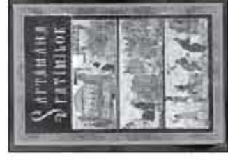
SĂPTĂMÎNA PATIMILOR 122 pag., format 145x145 mm. Preț 4,5 LEI.