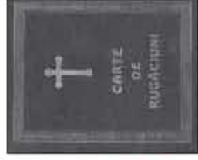
CARTE DE RUGĂCIUNI PENTRU FOLOSUL ORICĂRUI CREȘTIN (SCRIS NORMAL) (varianta IPS Andrei Andreicuț) interior la 2 culori, coperta tare, neagră 350 pag., format 110x145 mm. Preț 15 LEI.