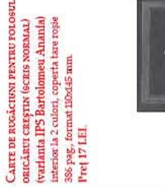
CARTE DE RUGĂCIUNI PENTRU FOLOSUL ORICĂRUI CREȘTIN (SCRIS NORMAL) (varianta IPS Bartolomeu Anania) interior la 2 culori, coperta tare roșie 386 pag., format 110x145 mm. Preț 17 LEI.