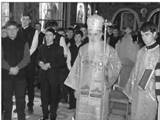
PS Vasile în timpul Sfintei Liturghii a darurilor mai înainte sfințite, la Seminarul Teologic Ortodox din Cluj-Napoca, 12 aprilie 2013.

Luni, 1 aprilie: Slujește Liturghia Darurilor mai înainte sfințite în Parohia „Sfântul Ioan Gură de Aur” din Cluj-Napoca.