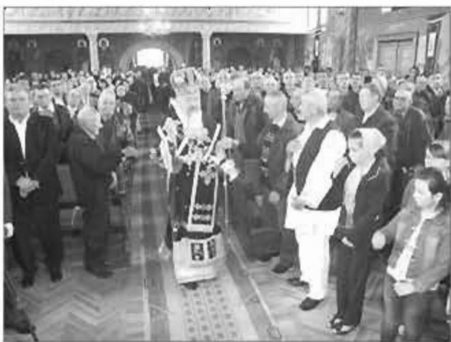
IPS Arhiepiscop și Mitropolit, Maieru, 21 aprilie 2013