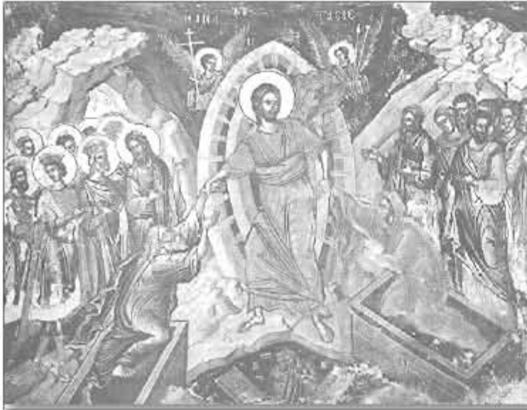
Teofan Cretanul, Pogorârea la iad , frescă, sec. al XVI-lea, Mănăstirea Stavronichita, Sfântul Munte Athos.