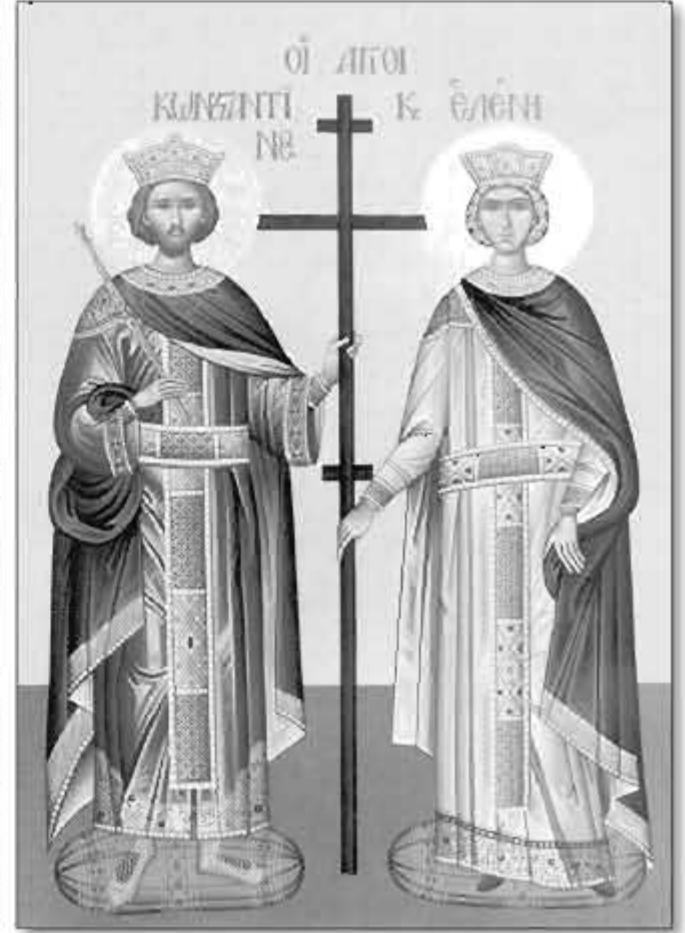
Icoană contemporană de la Mănăstirea Suroti, Grecia.

Ne spune Eusebiu de Cezareea și Lactanțiu că, în ajunul luptei cu Maxențiu la Podul Vulturului, Constantin a văzut pe cer ziua, în amiaza mare, o Cruce luminoasă, deasupra Soarelui, cu inscripția: în aceasta vei învinge. Noaptea i S-a arătat, în timpul somnului, Iisus Hristos cu semnul Crucii pe care-l văzuse ziua pe cer, cerându-i să-l pună pe steagurile soldaților 10 . Steagul acesta se numește labarum și avea pe el monograma lui Hristos. După ce a făcut acest lucru, a ieșit biruitor în luptă.