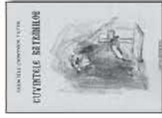
CUVINTELE BĂTRÂNILOR Părintele Dionysios Tatsis 100 pag., format 135x210 mm Preț 7 LEI.