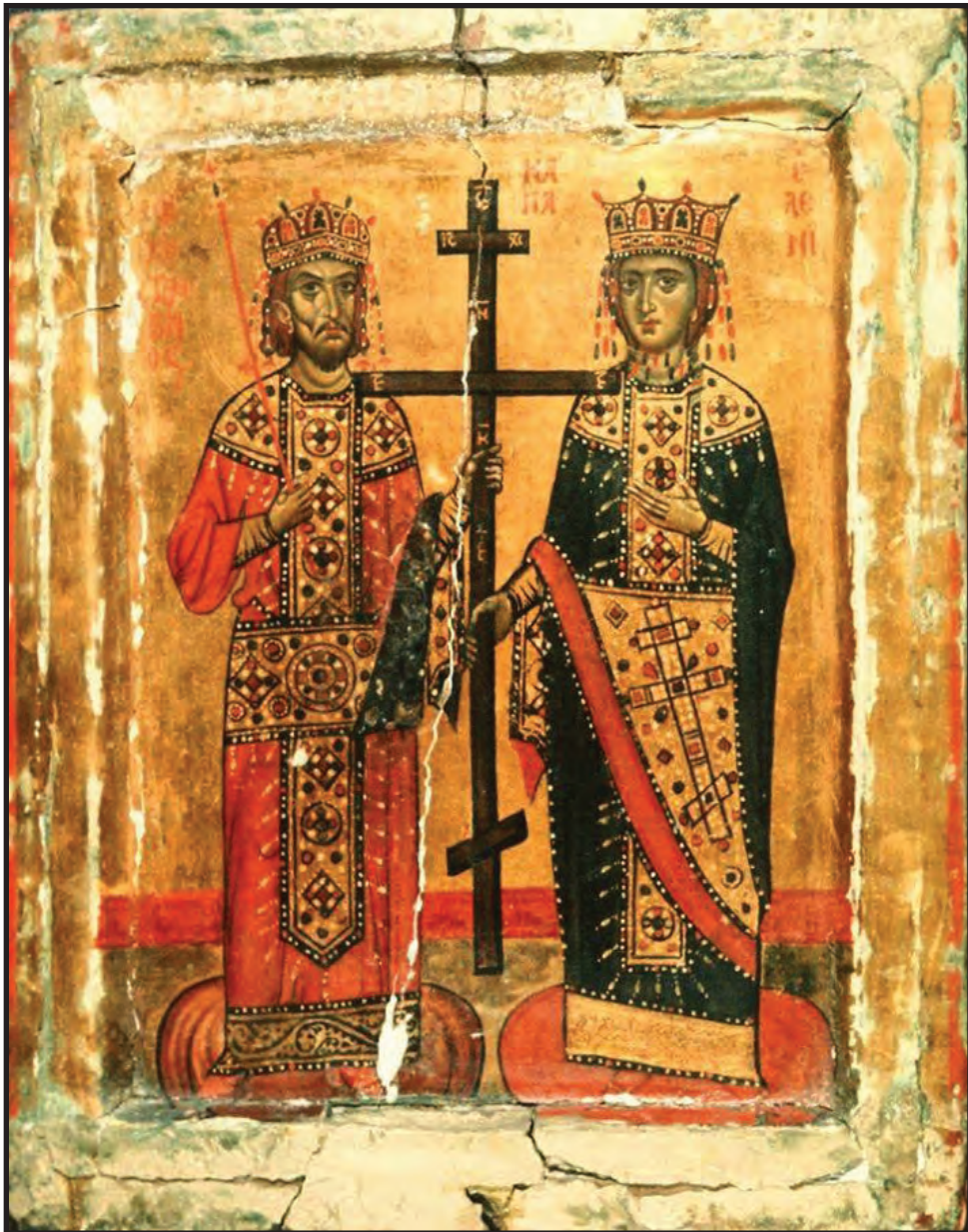
Sfinții Împărați Constantin și Elena.

Icoană portabilă din patrimoniul Mănăstirii Sfânta Ecaterina de pe muntele Sinai.