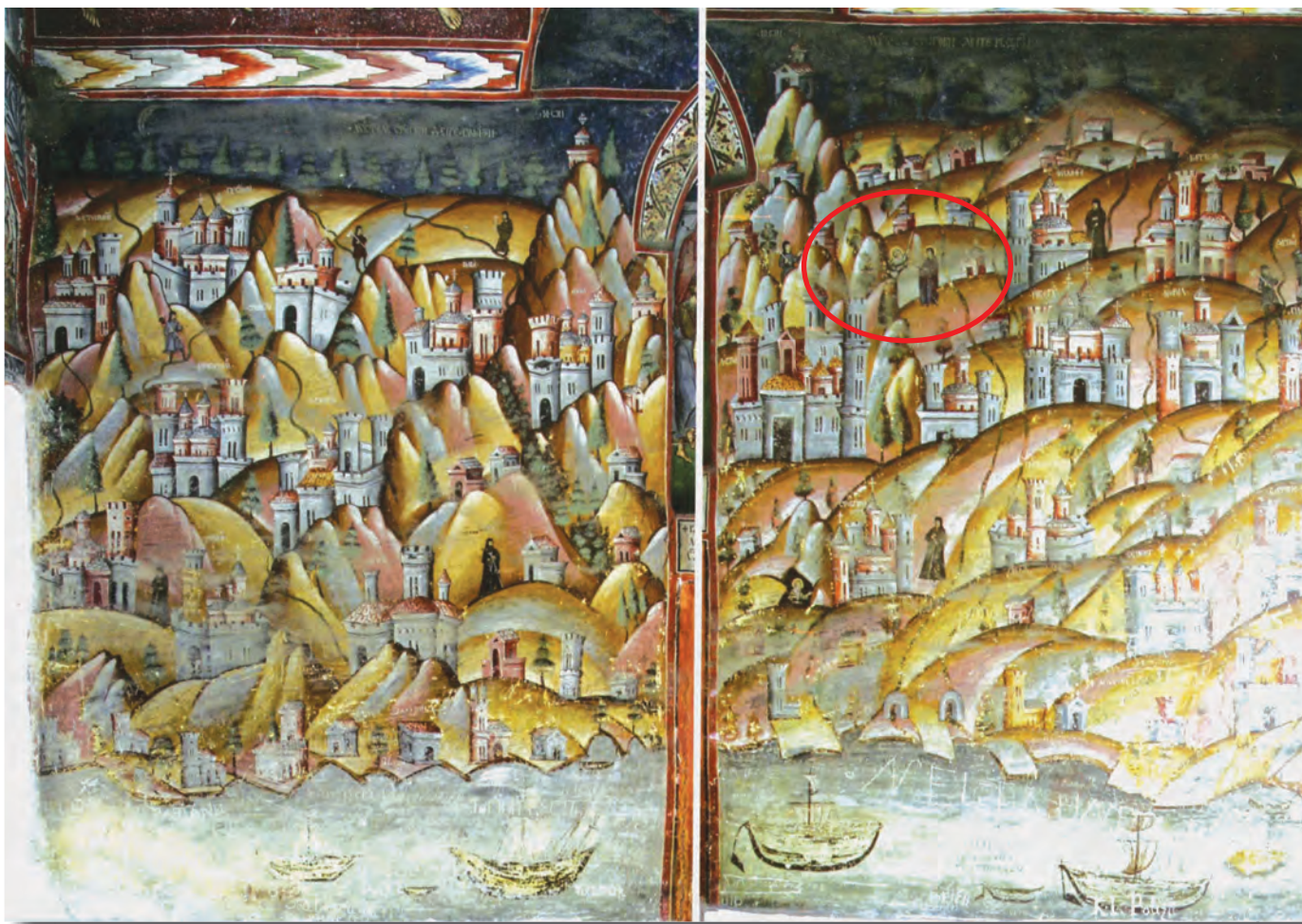
Sfântul Munte Athos, frescă din pridvorul Mănăstirii Polovragi, 1713.

Finalul povestirii e tot o propensiune spre lumină. Plecarea Liței Panaghia din mănăstire îi lasă din nou posibilitatea peregrinului apter de a o privi transfigurată în Femeia din frescă: „Acum lavița era pustie și-mi era dor de Lița Panaghia și nu puteam s-o văd decât pe Femeia din Athos, deasupra, firavă sub cununa ei de lumină” (p. 155).