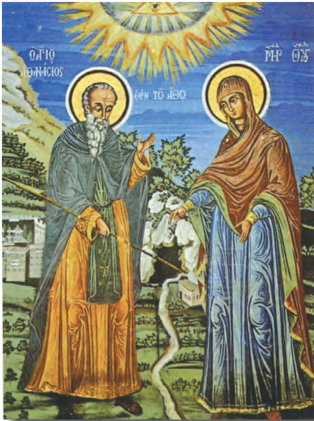
„Maica Domnului și Sfântul Athanasie Athonitul”, pronartextul mănăstirii Marea Lavră, Sfântul Munte Athos, sec. XIX.

cum se exprima V. Guroian 5 . Probabil că pictorul-zugrav de la Polovragi a cunoscut această tradiție a grădinii, căci sub pana lui, întregul Munte Athos devine o grădină, una a Maicii Domnului, ea însăși prezentă în această grădină. Geniul pictorului își găsește expresia maximă