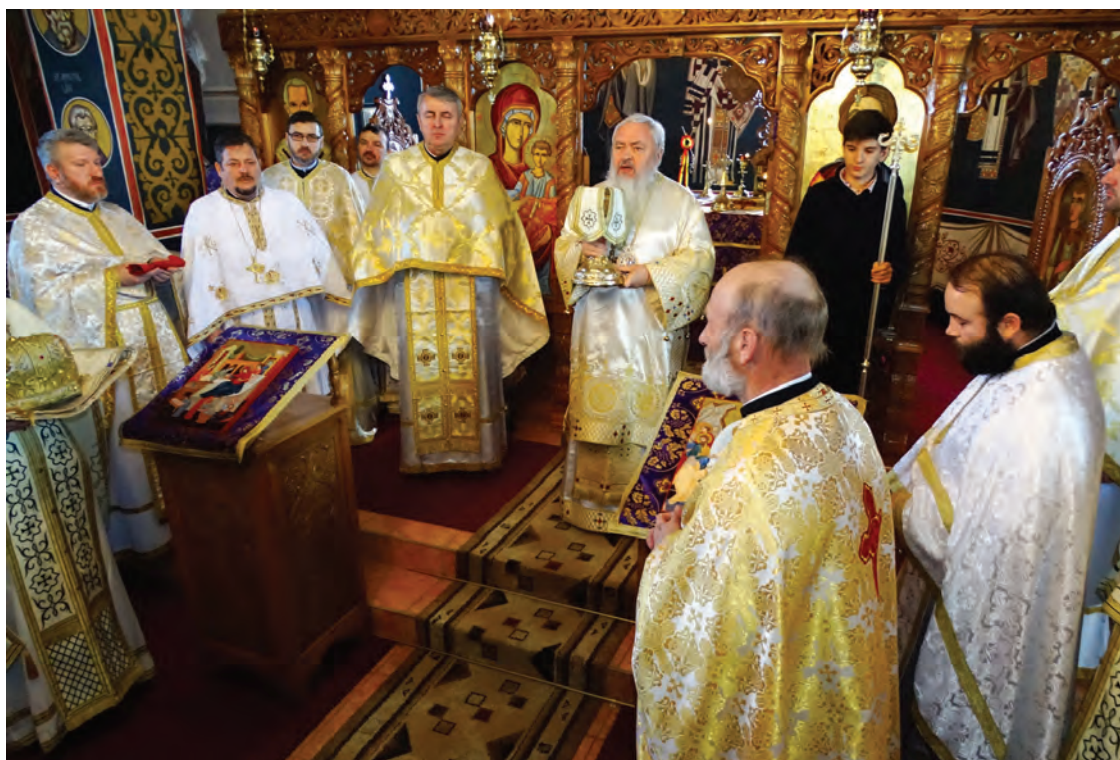
Înaltpreasfințitul Părinte Mitropolit Andrei, săvârșind Sfânta Liturghie în sobor în Parohia Iacobeni, Protopopiatul Turda, 24 februarie 2018.