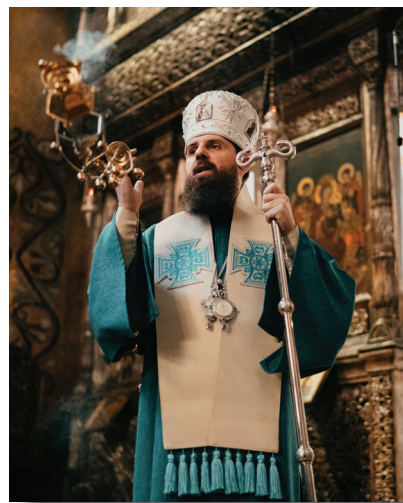
Preasfințitul Părinte Benedict Bistrițeanul, oficiind dumezeiasca Liturghie în Catedrala Mitropolitană, duminică, 21 februarie, 2021.

12 februarie: program de audiențe la birou; vizitează tabăra ASCOR organizată în localitatea Beliș. Rostește un cuvânt ocazional cu referire la darurile felurite ale Duhului Sfânt și aplicarea lor în procesul de teambuilding. Răspunde la întrebările tinerilor.