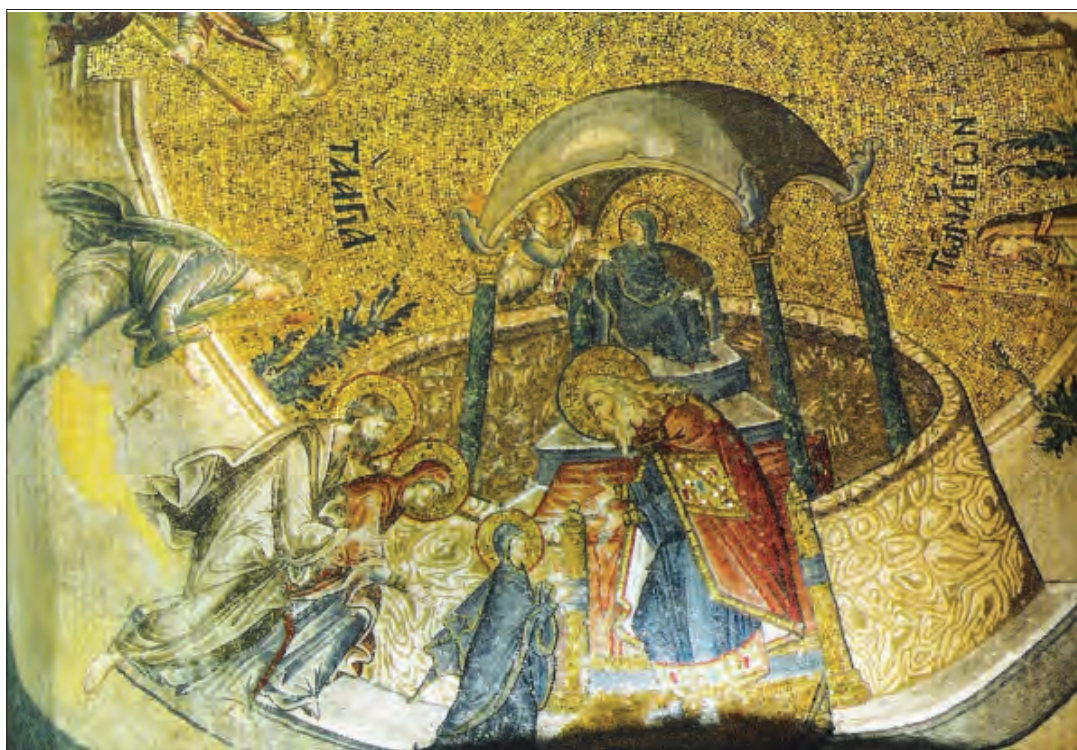
Intrarea în Biserică a Maicii Domnului , mozaic, sec. al XIV-lea, Mănăstirea Chora, Constantinopol.

Pictorii au imaginat acest moment festiv ilustrând trei elemente de ordin arhitectural și simbolic: Curtea templului, Sfânta și Sfânta Sfințelor. a) Curtea templului. Scena se petrece în interiorul curții templului sugerată de existența vâului roșu. Clădirea, porticurile ori acoperișul nu ne duc cu gândul la un templu oriental, ci dimpotrivă, ele sunt imaginate cu cupole, specifice bisericilor creștine. b) Intrarea în Sfânta. Opus templului se găsește Sfânta, definită de o construcție simbolică asemenea unui baldachin înalt în fața căruia se găsește preotul Zaharia. El este așezat pe prima treaptă a unei scări ce cuprinde un număr de cincisprezece trepte și evocă cei cincisprezece psalmi ai treptelor . c) Sfânta Sfințelor. Acest detaliu, deosebit de important, se regăsește în partea superioară a baldachinului amintit și este închisuit tot precum o construcție minimală ce se finalizează cu un acoperiș oriental. Porțile acestuia sunt închise fiindcă sunt simbolul vederii curate a lui Dumnezeu. În fața Fecioarei se află pictat un înger ce reflectă grija deosebită a lui Dumnezeu spre întărirea și creșterea ei cu pâine cerească. Petrecerea Mariei la templu s-a manifestat printr-o permanentă grijă și slujire, atât prin rugăciune, cât și prin muncă.