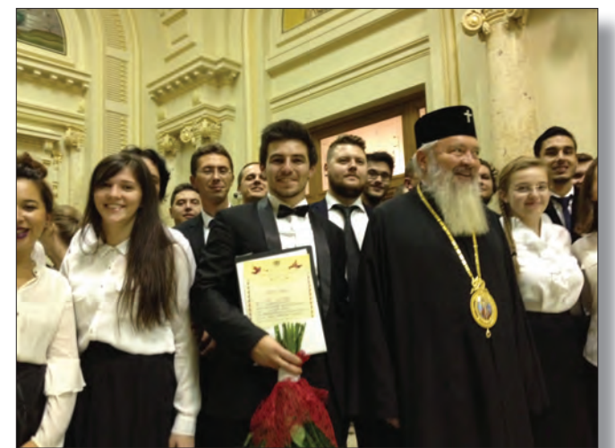
Înaltpreasfințitul Părinte Andrei, Mitropolitul Clujului, Maramureșului și Sălajului, alături de corul laureat, reprezentant al Mitropoliei.

În cadrul Secțiunii A – Interpretare la această etapă națională au participat șase coruri universitare, mixte sau de voci egale (fiecare reprezentând una din cele șase mitropolii de pe teritoriul țării) care au interpretat trei piese muzicale la alegere: o piesă religioasă ortodoxă din repertoriul românesc, o piesă religioasă din repertoriul internațional, o piesă românească de inspirație folclorică.