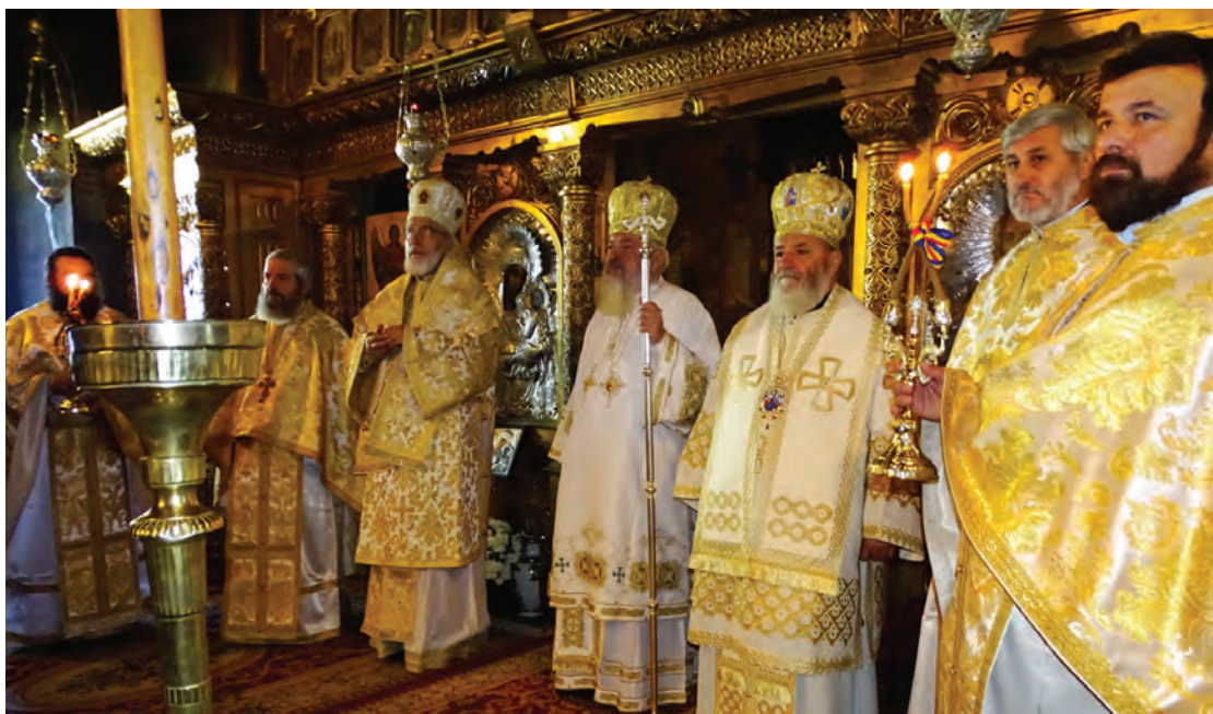
Înaltpreasfințitul Părinte Mitropolit Andrei oficiază Dumnezeiasca Liturghie, cu binecuvântarea Preafericitului Părinte Daniel, împreună cu ÎPS Părinte Calinic, Arhiepiscopul Argeșului și Muscelului, și PS Părinte Ilarion Făgărășanul, Episcopul Vicar al Arhiepiscopiei Sibiului, în biserica centrală a Mănăstirii Căldărușani cu prilejul hramului, Sfântul Dimitrie Izvorătorul de Mir, și rostește cuvânt de învățătură, 26 octombrie 2018.

ducerea Preafericitului Părinte Patriarh Daniel, participă la ședința de lucru a Sfântului Sinod al Bisericii Ortodoxe Române.