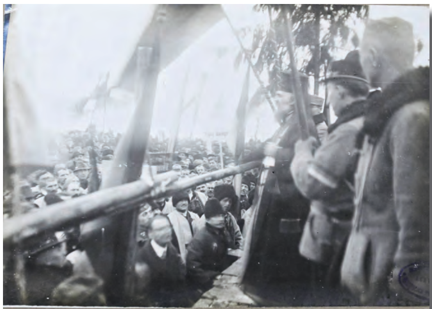
4.) Vorbirea P. S. S. episcopul Caransebeșului Dr. Miron E. Cristea către poporul din „Țara Hațegului” și jur în Alba-Iulia la 1 Decembrie n. 1918.

Deși au trecut veacuri de atunci, totuși și acum aud cum geme din fundul temniței regele munților Iancu, aud mai ales suspinele și sfâșietoarele urlete de durere ale mucenicilor Horea și Cloșca, care aici, pe locul unde stăm acum au fost trași pe roată.