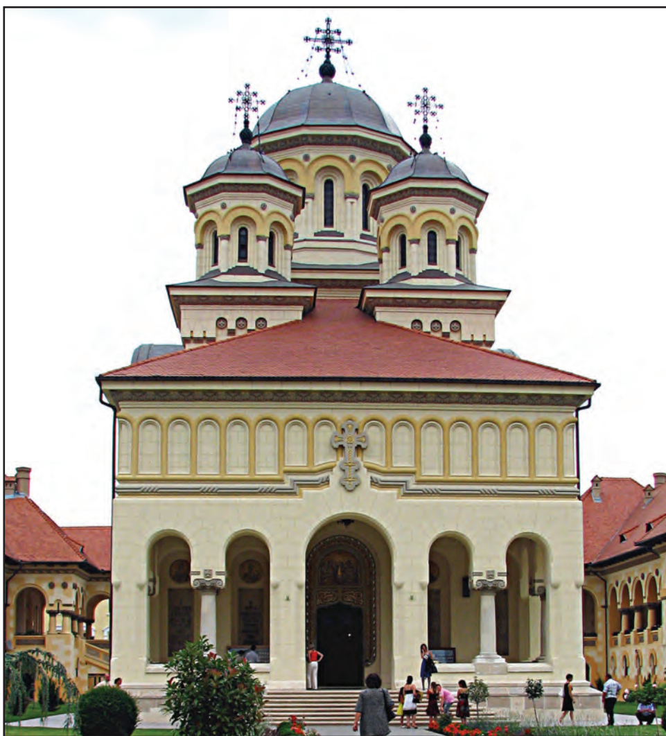
Catedrala Reîntregirii din Alba Iulia