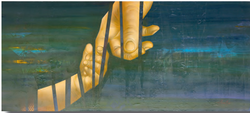
Tablou de Florin Olari.

După această analiză introductivă vom face apel la un prim cuvânt al Sfântului Isaac în care acesta afirmă necesitatea unei astfel de lucrări, în înțelesul său ascetic: „De nu ne vom smeri, nu vei înceta să ne smeresti pe noi”. Atât în înțeles religios, cât și filosofic, cunoașterea de sine nu este doar un exercițiu al vieții, ci lucrarea de căpătâi a acesteia. De aceea se întrevede o parte consistentă a omului în acest demers, dar și o parte a lui Dumnezeu, Care ne vine în ajutor și ne oferă contexte în care să experimentăm smerenia, mai ales atunci când noi le evităm pe unele ca acestea din frică sau comoditate. Căderile noastre, resurse limitate pentru a face unele lucrări, suferințele, sărăcia, bolile uneori sau alte situații, toate pot să fie contexte în care să învățăm starea de smerenie, care poate să ne reazeze în proximitatea lui Dumnezeu, de unde am căzut prin părerea de sine. În acest caz, smerenia se trăiește și ca nevoie de ajutor și, de aici, deschiderea înspre colaborarea sinergică cu Domnul. Iar, în continuare, apropierea de celălalt ne face să nu-l mai vedem ca pe cel care ar vrea să ne ia locul, ci ca pe unul asemenea nouă, cu locul și rostul său, fiind capabili să acceptăm să împărțim cu acesta „cinstea” pe care noi înșine o primim de la Dumnezeu și de la oameni.