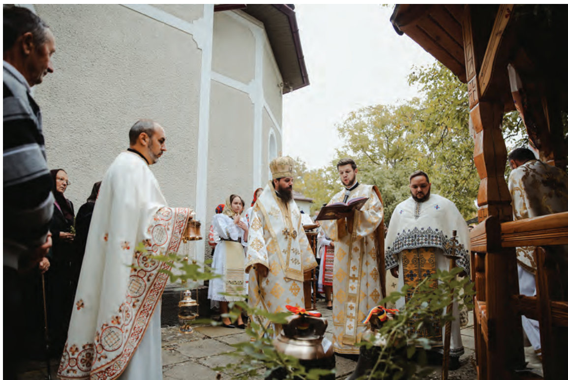
Preasfințitul Părinte Benedict Bistrițeanul oficiază slujba sfințirii clopotelor în parohia Sita, Protopopiatul Beclean, 8 octombrie 2023.

La programul de Master, predă cursul „Teologia experienței la Sfântul Macarie Egipteanul, Sfântul Isaac