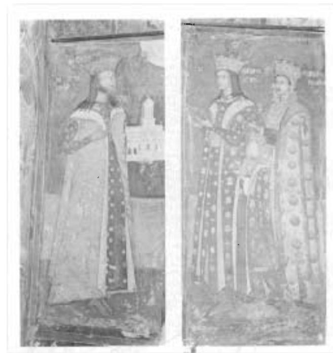
Radu Paisie. Tablou votiv în Biserica-Bolniță a Coziei

de către pictor printr-o altă modalitate artistică (dacă e să o comparăm cu cea de la Argeș), și anume prin apariția aici, pentru prima dată în pictura românească, a unui înger care îl încoronează atât pe Radu Paisie, cât și pe fiul său Marco. Și dacă până acum, în iconografie, ctitorii erau binecuvântați de către Mântuitorul Iisus și Fecioara Maria, acum ei sunt încoronați de către îngerii din ceruri. Prin aceasta se dorea scoaterea în evidență a calităților lor de voievozi, puși în scaun de către îngeri, fiul lui