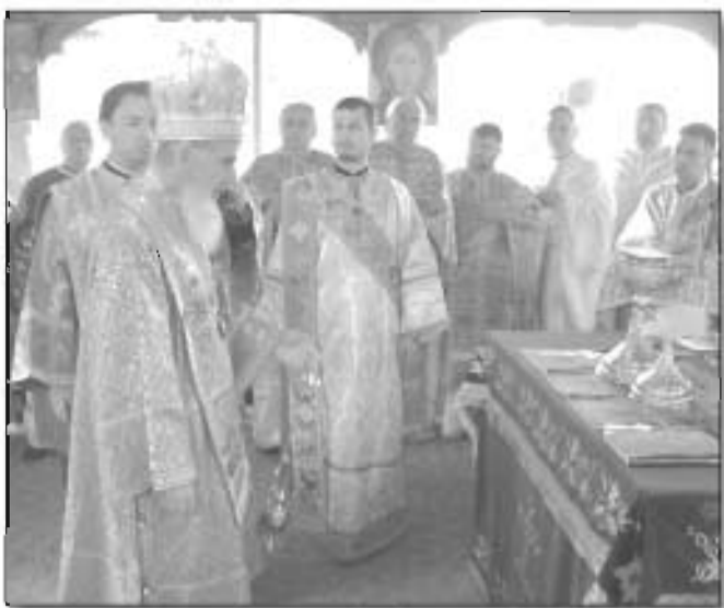
PS Vasile Someșanul, Sfânta Liturghie la mănăstirea Cășiel, 14 septembrie, 2013.