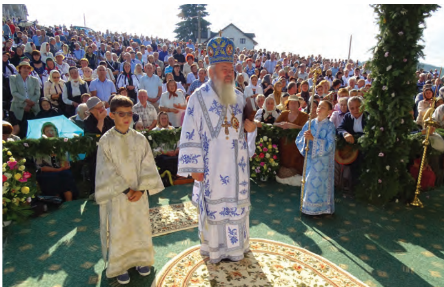
Înaltpreasfințitul Părinte Mitropolit Andrei săvârșind Sfânta Liturghie pe altarul de vară al Mănăstirii Piatra Fântânele, 8 septembrie, 2016.

15 septembrie: În Sala „Nicolae Ivan” din incinta Centrului