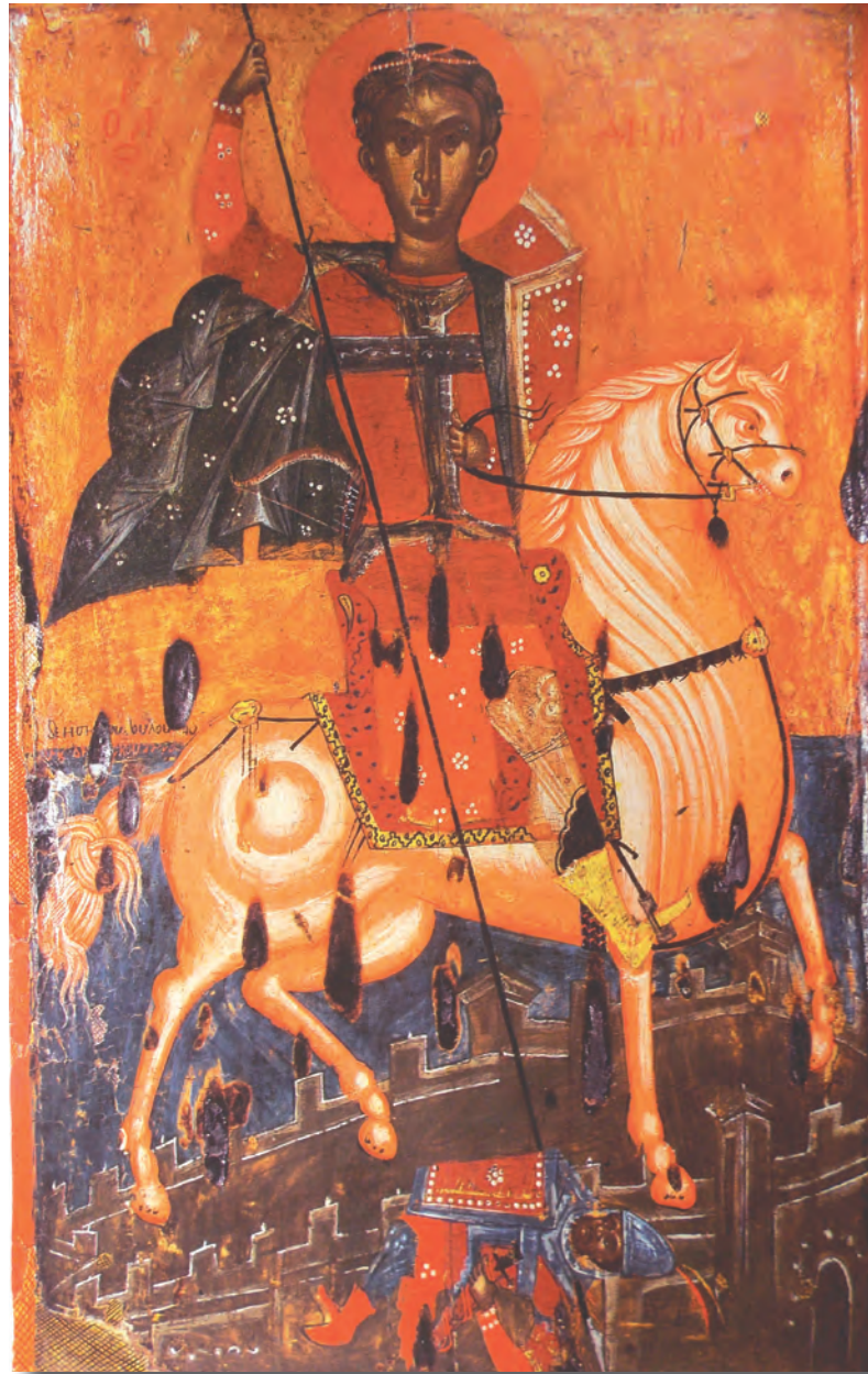
Sfântul Mare Mucenic Dimitrie Izvorătorul de Mir, tempera pe lemn, sec. al XVII-lea, Muzeul de istorie, Malko Târnovo.

Privind icoana, să retrăim minunile săvârșite de Sfântul Mare Mucenic Dimitrie, rostind împreună: Mare apărător te-a aflat întru primejdii lumea, Purtătorule de chinuri, pe tine cel ce ai biruit pe păgâni. Deci, precum mândria lui Lie ai surpat și la luptă îndrăzneț ai făcut pe Nestor, așa Sfinte Dimitrie, pe Hristos Dumnezeu roagă-L să ne dăruiască nouă mare milă.