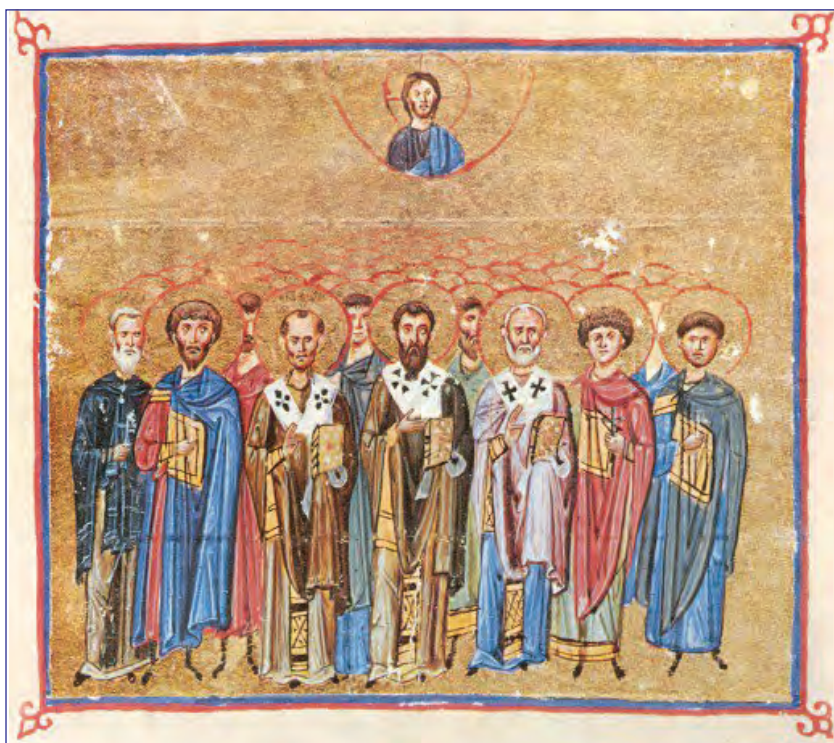
Prevederi canonice privind consecințele ruperii comuniunii cu episcopul locului

Această înțelegere nu face din slujirea și judecata episcopului un act discreționar, deoarece, episcopul este obligat să aibă față de fiecare mirean sau cleric o judecată în care să dea dovadă de discernământ eclezial, fără prejudecată sau „micime sufletească”. Din acest motiv, canonul 5 al Sinodului I ecumenic arată că fiecare episcop trebuie să dea socoteală sinodului, de două ori pe an, pentru modul în care a gestionat comuniunea ierarhică pe care este chemat să o consolideze în eparhie.