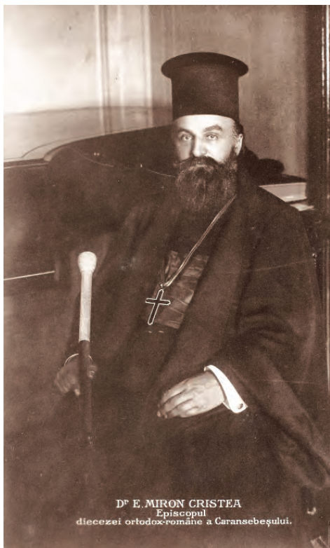
DR. E. MIRON CRISTEA Episcopul diecezei ortodox-române a Caransebeșului.