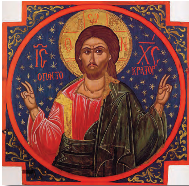
b. „Iisus-Proful” în contrastul „lumină-întuneric”

Prin urmare, „Iisus-Proful”, potrivit cuvântării de la Sărbătoarea Corturilor, din Ierusalim, nu este doar descendentul lui David sau un profet egal cu Moise; El este mult mai mult: Este Profetul prin care Duhul Sfânt vine în lume; Este profetul eshatologic al vieții pnevmatologice a Bisericii creștine din toate timpurile. Așadar, „Iisus-Proful” Evangheliei a IV-a este Dumnezeu! Trebuie subliniată, și în acest context, superioritatea perspectivei Evangheliei după Ioan asupra dimensiunii teologice a titlului de „Profet” acordat lui Iisus, comparativ cu cel prezent în Evangheliile sinoptice.