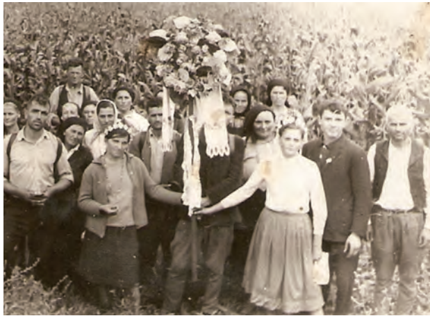
Pelerini pe drumul de întoarcere de la mănăstirea Nicula, 1968.

Această idee de a trece într-un loc nou, văzând lucrurile într-o nouă lumină, reamintește de o frază care ne este familiară nouă, tuturor: „Ușile pocăinței deschide-mi, Dătătorule de viață!” [ Τῆς μετανοίας ἀνοιξόν μοι πύλας, Ζωοδότα ]. În fiecare Duminică a Postului Mare cântăm la Utrenie aceste cuvinte, în fiecare post începem o călătorie, înăbușind o patimă, biruință pe care numai noi o putem obține trecând prin ușile pocăinței. În fiecare post, creștinii ortodocși sunt chemați să realizeze propria lor înstrăinare, ξενιτεία , care e situată în inima vieții monahale. Căci pelerinajul este mai mult decât un pelerinaj spațial - călătoria într-un alt loc, la un loc sfânt -: pentru a fi un pelerinaj real el trebuie de asemenea să vizeze călătoria interioară pe care o realizăm pe parcursul vieții noastre, o călătorie pe care suntem chemați s-o începem iar și iar, după cum căutăm să ne facem cale prin ușile pocăinței.