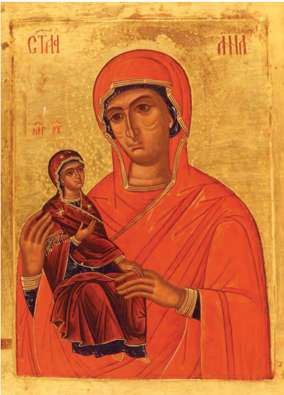
Sfânta Ana, mama Maicii Domnului, cu Preasfânta Fecioara Maria în brațe. Icoană portabilă pe lemn (38x48), sec. XVII, Mănăstirea Sfântul Pavel din Sfântul Munte Athos.