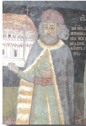
Mihai Viteazul, portret în biserica Sf. Arhangheli din Ocna Sibiului, 1723.

Venerația de care s-a bucurat Mihai Viteazul în rândurile românilor ardeleni s-a manifestat și în arta bisericească transilvăneană. O dovedesc portretele sale din biserica Sfântul Nicolae din Șcheii Brașovului, restaurat de zugravul Radu la 1694 și din biserica Sfinții Arhangheli Mihail și Gavril din Ocna Sibiului, zugrăvit în anul 1723 de Ivan din Rășinari, unde chipul lui Mihai este înfățișat cu barbă și păr stufos, nas acvilin și trăsături energice, așa cum îl cunoaștem din documentele de