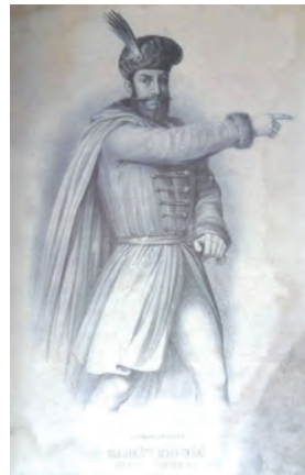
Mihai Viteazul, eroul românilor, Buda, 1801

Nu în ultimul rând trebuie amintit portretul, mai puțin cunoscut, al lui „Mihai, eroul românilor”, realizat în capitala Ungariei, la Buda de un oarecare Areon în 1801 și păstrat cu sfințenie – alături de o cronică scrisă la Nürnberg despre Mihai Viteazul în 1603 – în Muzeul Bisericii Sf. Nicolae din Șcheii Brașovului 19 , comunitate bisericească considerată bastionul ortodoxiei transilvănene în cursul secolului XVIII.