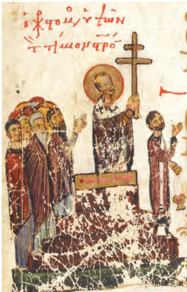
Sf. Ioan Gură de Aur înălțând Sfânta Cruce în fața cinstitorilor. Miniatură care decorează Psalteria cunoscută sub denumirea de Theodor Psalter (Feb 1066), manuscris păstrat în British Library.

Elevii de astăzi învață prea mult despre lucruri care nu îi privesc la modul direct, despre trup, și aproape deloc despre suflet și legile lui. Ei învață cum trebuie să circule pe stradă pentru a nu se accidenta, dar află de la școală prea puțin despre cum trebuie să se ferească de păcat și despre cum să-și păzească curățenia sufletului (și a trupului care e „templul lui Dumnezeu”), prea puțin despre pocăință și posibilitatea curățirii prin spovedanie. Ne aducem aminte că Sfântul Ioan definea educația ca un mod de a îngriji sufletul copiilor. Mai mult decât a păzi (care e un termen defensiv), educația înseamnă pentru el cultivarea acestei curățenii, dezvoltarea personalității pe