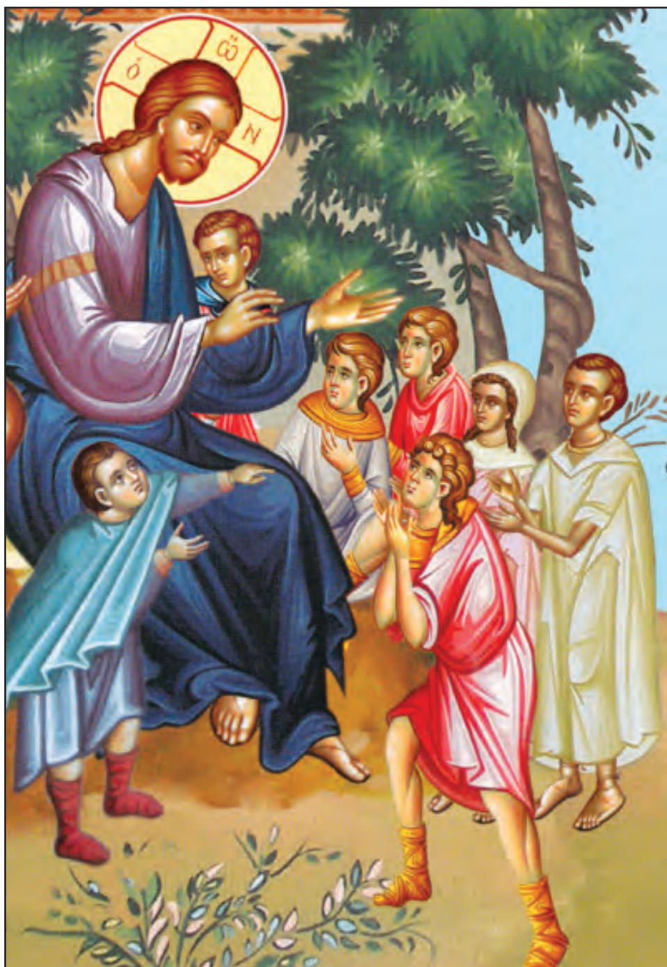
„Lăsați copiii să vină la Mine” (Lc 18, 16). Icoană contemporană.