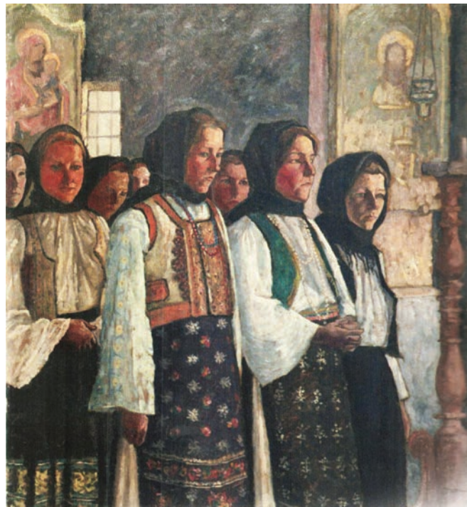
Țărănci în biserică, pictură în ulei de Camil Ressu (1880-1962).

Sper ca limba română, care poartă în ea atâtea iubire, să nu sucumbe asaltului urii și indiferenței și să dea mereu măsura felului nostru de-a fi, iar acesta să-și afle măsura după seninul ei, nu după bâiguiala acelora care o târăsc în mlaștina care le bălțește în suflet! Ajuțați-o să fie în rostul și slava rostirii ei. Îmbolnăviți-vă de ea, de suferirile ei! Fiți bolnavi de limba română, ca să rămâneți sănătoși în firea și starea Domniilor Voastre! Fiindcă fără de ea, nu doar ai ființei noastre nu mai suntem, ci nici ai acestui pământ!