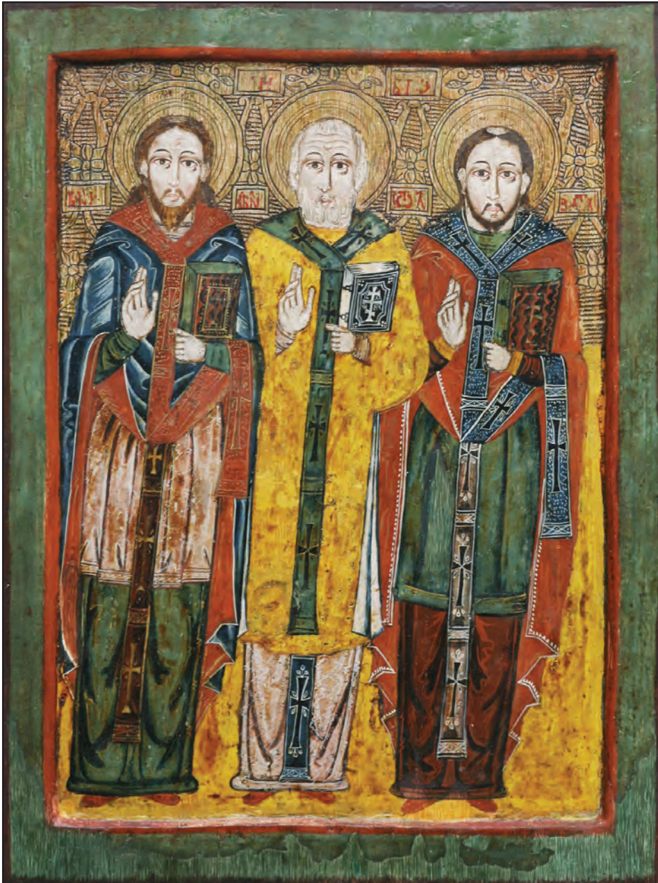
Sfinții Trei Ierarhi. Icoană pe lemn de la sfârșitul secolului XVII, pictor maramureșan, provenită din satul Rugășești, județul Cluj, expusă la Muzeul Mitropolitan din Cluj-Napoca.