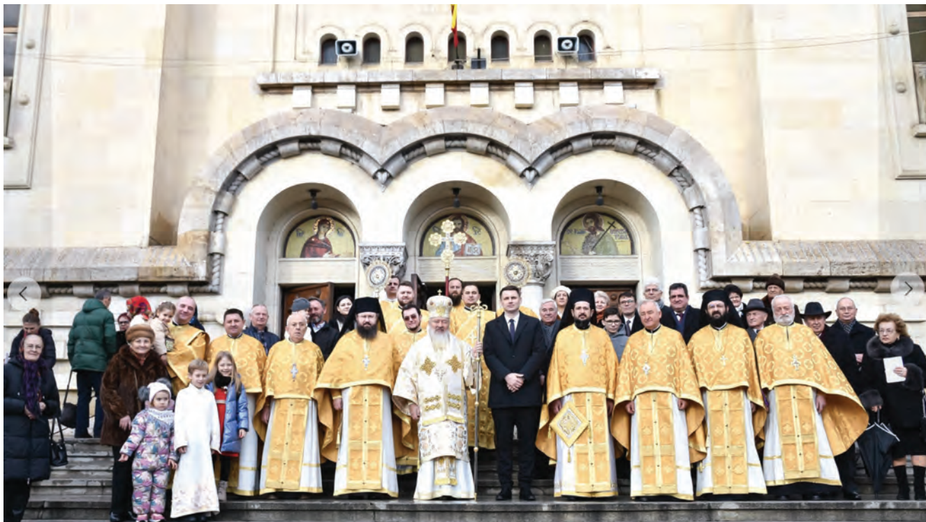
IPS Părinte Arhiepiscop și Mitropolit Andrei, în mijlocul clericilor și credincioșilor după încheierea Sfintei Liturghii din ziua praznicului împărătesc al Nașterii Domnului, pe treptele Catedralei Mitropolitane din Cluj-Napoca, 25 decembrie, 2023.